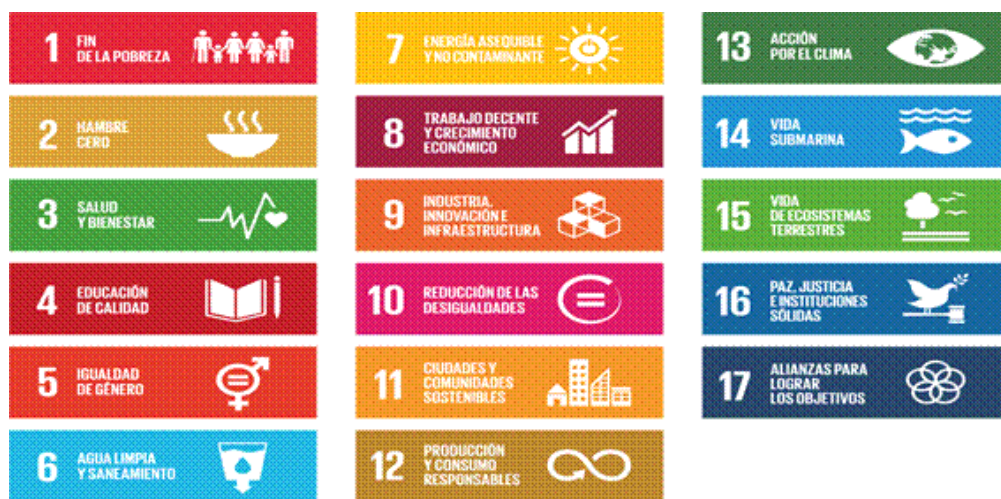
Figura 1: Objetivos de Desarrollo Sostenible.

persiguen afrontar el cambio climático, prevenir el deterioro planetario y de los recursos, propiciar el desarrollo de un gran potencial de crecimiento económico en todas las regiones y para todas las personas y lograr patrones de producción y de consumo sostenibles. A la vez, que pretenden promover la construcción de sociedades mas justas, pacíficas y cooperativas.