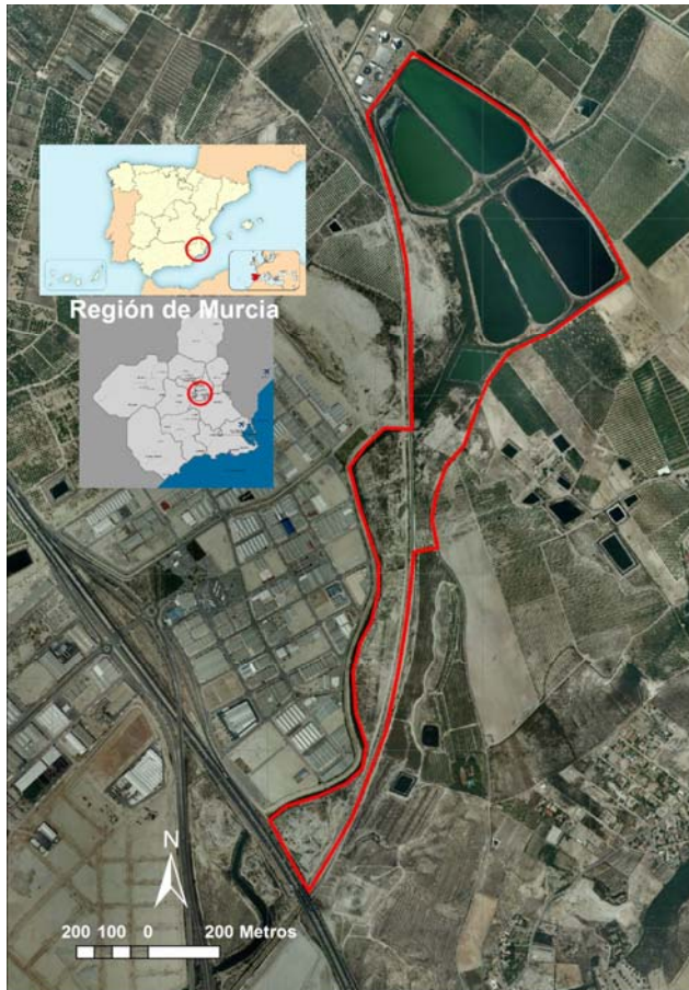
Figura 1. Localización de las lagunas de Campotéjar 1 .

paraje de Campotéjar Baja, entre la autovía N-301, el Km 435 de la línea férrea Madrid-Cartagena y el canal del trasvase Tajo-Segura.