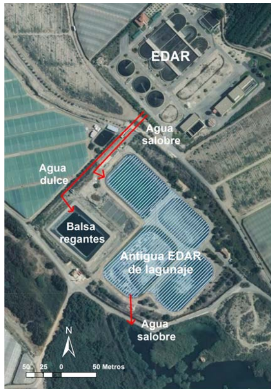
Figura 4. Circulación del agua dulce y del agua salobre 4 .

La Estación Depuradora de Aguas Residuales mediante el sistema de lagunaje de Mazarrón estuvo funcionando a lo largo de la década de los 90, cesando su actividad en 2005, cuando se pone en marcha la nueva EDAR, con una capacidad de depuración de 15.000 m 3 /día, para una población de unos 15.000 habitantes. Actualmente, su diseño le permite tener una capacidad de depuración de 2.060.308 m 3 /anuales, para una población de 15.150 personas (ESAMUR, 2013).