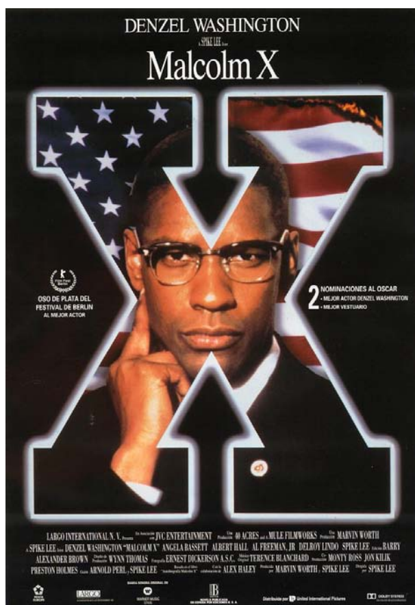
Cartel de la película Malcolm X en España