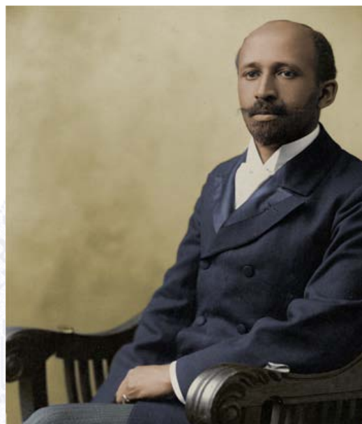
William Edward Burghardt Du Bois impulsor del Panafricanismo congresual

y tendían a tener una visión holística e incluso idealizada del continente de origen la Madre África. Se articula en dos grandes movimientos, por una parte a partir de principios del siglo XX en torno a los congresos panafricanos de carácter parcialmente elitista, impulsados por el filósofo africano-norteamericano W.E.B. Du Bois que buscarán mejorar las condiciones de vida de los colonizados en África, mediante peticiones organizadas a los colonizadores, para finalmente, a partir del Congreso de Manchester de 1945 lanzar una proclama por la independencia total que acabaría lográndose desde finales de los 50 y principalmente en los 60.