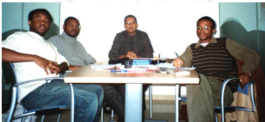
Miembros de la Junta directiva de la Muunganiko editora de Nsibidi en diciembre de 2004

Un factor a considerar es la capacidad de las asociaciones panafricanas de crear medios y redes informativas. Diversas publicaciones, junto con la popularización de Internet con los foros de debate y los chats, irán adquiriendo una importancia creciente en la concienciación panafricanista en España. Algunas revistas relacionadas con organizaciones no gubernamentales asistenciales clásicas o pertenecientes a las iglesias misioneras, como Tam-Tam Afromagazine Internacional vinculada a SOS África en Barcelona o Mundo Negro de los misioneros Combonianos son pioneras en el tratamiento de información exclusivamente africana, en este caso por supuesto bajo el tamiz ideológico de la iglesia católica. En estas publicaciones se fijan quienes buscan cubrir un ámbito más laico y en ocasiones socialmente combativo. La Revista de la Asociación de Mujeres Africanas E Waiso Ipola es una abridora de caminos, tras esta y ya a principios del presente siglo surgen medios como la revista electrónica Nsibidi con sede en Palma de Mallorca, Culturas Africanas sucesora de la interrumpida Omowale, Afrotown, y en radio la Voz de África Radio integrada en Onda Verde del Movimiento Contra la Intolerancia. A