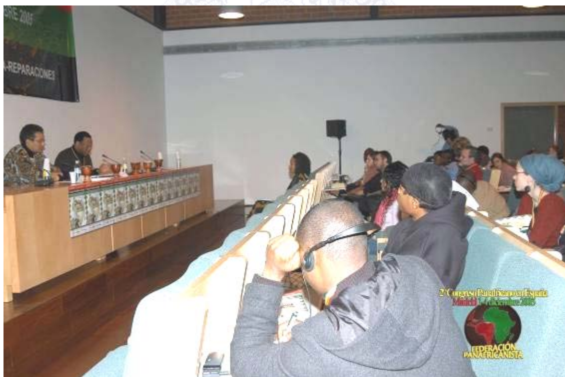
Imagen del Segundo Congreso Panafricano en España. 1 a 4 de diciembre de 2005

El 31 de mayo de 2010 el Partido Socialista Obrero Español convocó en un local del multicultural barrio madrileño de Lavapiés, con motivo del cincuentenario de las independencias africanas, una reunión con representantes de la comunidad negra Española de diversos ámbitos. Acudieron cerca de cien personas del asociacionismo, la cultura, la intelectualidad, el mundo académico y ciudadanos diversos a título particular ( http://www.psoe.es/afrosocialista/noticia del 30 de mayo ). El objetivo de la reunión según fue convocada era exponer la reivindicación de la comunidad negra recogida por el “Grupo Federal Afrosocialista” de un “Instituto de Cultura