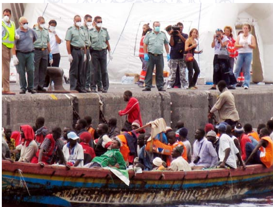
Llegada de un cayuco en la isla canaria de La Gomera

Federación Panafricanista, Fundación Vida Grupo Ecológico Verde, Alto Consejo de las Comunidades Negras de España, Asociación Juvenil Panteras Negras y Centro Panafricano Kituo cha Wanáfrika, son en la actualidad sin ninguna duda las entidades panafricanas y panafricanistas más destacadas: Federación Panafricanista, Centro Panafricano, Panteras Negras y Fundación Vida Grupo Ecológico Verde son las más activas y constantes en su trabajo