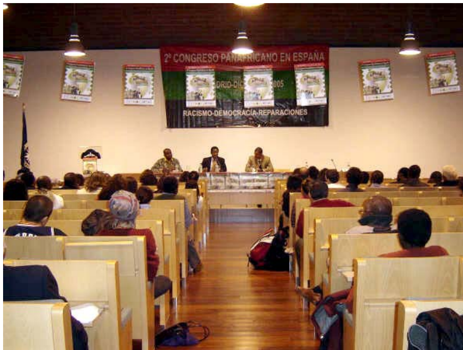
El Segundo Congreso Panafricano celebrado en la UNED, Escuelas Pías, Lavapiés Madrid en diciembre de 2005