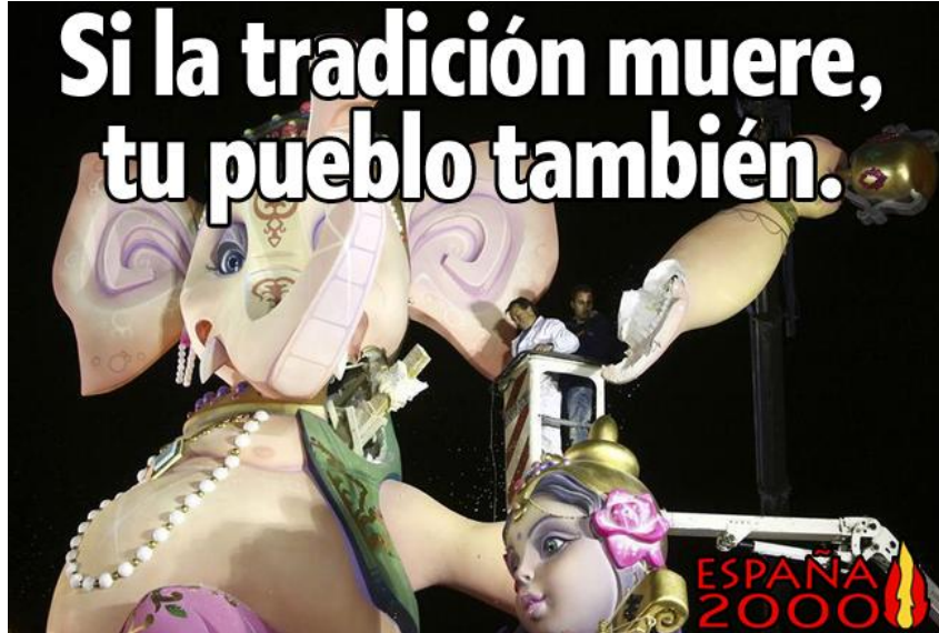
Figura 1. Imagen difundida por el partido político España 2000.