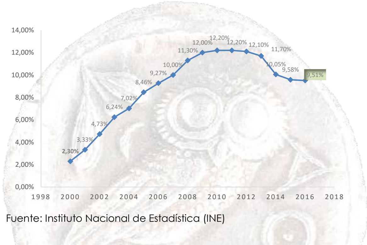
Gráfico 1. Evolución de la tasa de inmigración en España (2000-2016)

Fuente: Instituto Nacional de Estadística (INE)