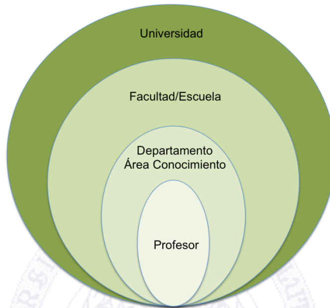
Figura 1. Escenarios de Uso. Enseñanza-Aprendizaje 2.0

áreas o departamentos, las escuelas y facultades o las universidades en su globalidad, como se puede observar en la Figura 1.