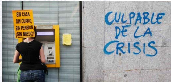
8. Pintada "Culpable de la crisis" (Madrid)