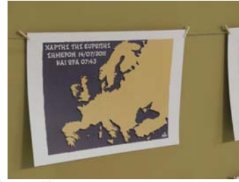
6. Hantzopoulos (2011)