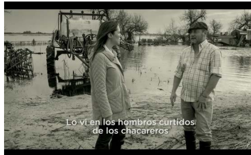
Figura 1. Lo vi en los hombros curtidos de los chacareros

De manera tal que la Figura 1 corresponde a los 00' 19" del video referido (Macri, 2015), y allí se puede ver a la candidata a gobernadora bonaerense junto a un chacarero en el campo inundado, ambos con mucha seriedad, conversando.