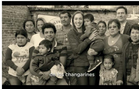
Figura 2. Lo vi en las frentes altas de los changarines

La Figura 2 corresponde a los 00' 24" del video, y allí se puede ver a la candidata junto a mujeres, hombres y niños, posando para una fotografía mientras ella sostiene a un pequeño niño en brazos.