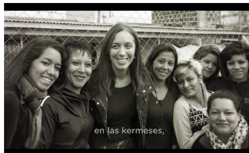
Figura 3. Lo vi las kermeses

La Figura 3 corresponde a los 00' 27" del video, y allí se puede ver a la candidata junto a mujeres, posando sonrientes para una fotografía.