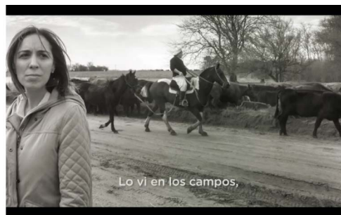
Figura 5. Lo vi en los campos

La Figura 5 corresponde a los 00' 46" del video, y allí se puede ver a la candidata en primer plano en el lado izquierdo de la fotografía, mirando con preocupación, mientras detrás hay un trabajador rural a caballo, arreando ganado.