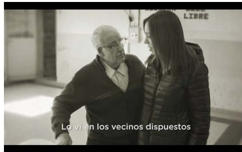
Figura 4. Lo vi en los vecinos dispuestos