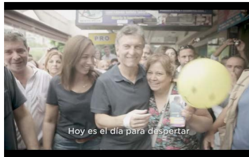
Figura 7. Hoy es el día para despertar:01' 00"