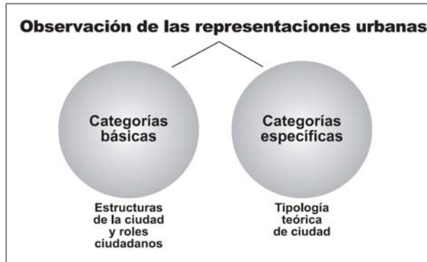
Figura 2. Categorías básicas y específicas