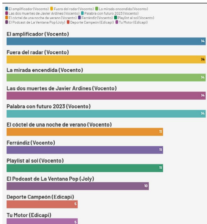
Figura 3. Pódcast difundidos por un mayor número de diarios

La preponderancia de Vocento también se advierte al examinar los pódcast difundidos por un mayor número de diarios puesto que entre los 11 con una mayor cantidad de cibermedios figuran ocho de Vocento, justamente los ocho primeros (figura 3). Son remarcables los ejemplos de 'El amplificador', 'Fuera del radar', 'La mirada encendida', 'Las dos muertes de Javier Ardines' y 'Palabra con futuro 2023', todos ellos distribuidos mediante una acción de carácter corporativo a través de los 14 diarios de Vocento que apuestan por este formato: Burgos Conecta , El Comercio , El Correo , El Diario Montañés , El Diario Vasco , El Norte de Castilla , Hoy , Ideal , La Rioja , Las Provincias , La Verdad , León Noticias , Salamanca Hoy y Sur .