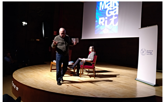
O poeta Joan Margarit nunha das súas intervencións

Continuando coa poesía, a Facultade de Filoloxía da UCM homenaxeou o poeta catalán Joan Margarit elaborando un volume con poemas do propio autor traducidos a diferentes linguas. Entre estas, podemos encontrar a colaboración da lectora con varios poemas verquidos ao galego. Tras a súa elaboración, a facultade convidou o poeta o 21 de marzo para vir e falar do que mellor coñece: o acto da escrita. A entrevista ao autor, que se desenvolveu nun espazo repleto, foi un acto interesante e reflexivo grazas ás intervencións do propio Margarit.