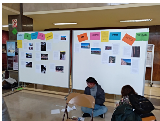
Alumnado montando os paneis coa exposición Un ollar por Madrid

preferidos. Neste sentido, e coa finalidade de animar a votación, preparamos unhas papeletas e unha caixa que serviu de urna. Cabe ressaltarmos, xa que logo, que actividade foi ben acollida polo público, pois houbo un número considerable de textos votados.