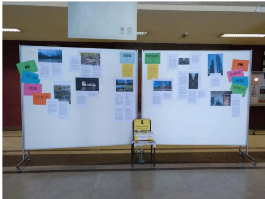
Panel coa exposición fotográfica Un ollar por Madrid e no centro a caixa usada para votar

facultade, en concreto o vestíbulo do Edificio A, para colocarmos os relatos e as fotografías a modo de exposición. Esta actividade permaneceu alí durante aproximadamente tres semanas, para o goce de todas as persoas que estivesen interesadas e, ademais, aquelas que quixesen podían tamén votar polo seu texto preferido. Para isto último, a profesora Colom e eu fixemos un caixa e unhas papeletas para votar.