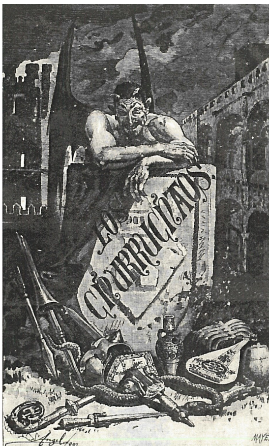
Fig. 2. Portada ilustrada de Henrique Mayer para “Los Churruchaos”

impresión do lector unha mestura entre a novela gótica de Vicetto e as teses de gusto pola veracidade do documento, cuxo testemuño se reforza na hipótese –indemostrable– dunha presunta testemuña ocular que, a priori , debeu trasladar fielmente tódolos feitos sanguentos .