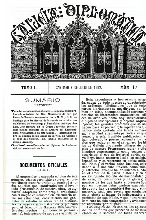
Fig. 1. Portada do primeiro número de Galicia Diplomática

O rexionalismo de GD maniféstase a través da idea dunha unificación das catro provincias, xa dende o aspectos políticos ou xa dende a visión de crear un lugar onde conservar axeitadamente o patrimonio pasado 17 ; enténdese así que o seu rexionalismo 18 veña dado pola idea dunha restauración —en parte— do