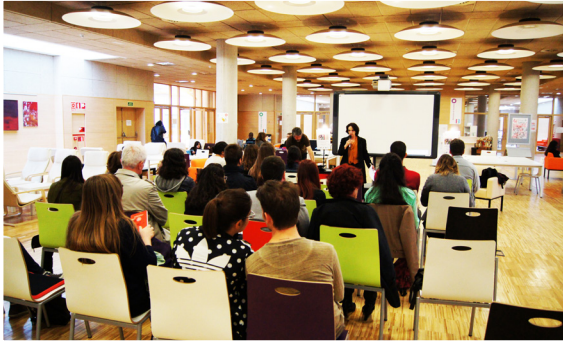
Presentación do documental O instante eterno