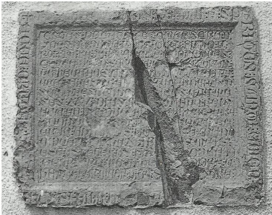
Fig. 2. Lápida dos pazos de Ferreira do Zêzere (Barroca 2000: 3, 491)

do Mestre de Cristo, Gonzalo Tenreiro 30 . Así pois, no primeiro caso, atina coa data exacta do inicio do seu mestrado (andados 4 anos, 7 meses e 26 días do 05/07/1362), como xa vimos, o 8 de novembro de 1357, pouco despois do entronizamento de Pedro I 31 .