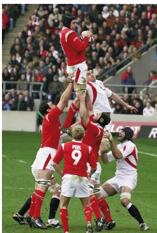
Partido de rugby. Ddfree.

Outro campo de importancia na Galipedia é o das personalidades. Aparecen recollidas persoas con importancia nos seus campos de traballo, desde as diferentes xefaturas de estado actuais, as persoas premiadas cos premios Nobel ou Óscar, os papas e antipapas da igrexa católica apostólica romana ao longo do tempo, membros da selección de rugby de Nova Celandia, ou os diversos