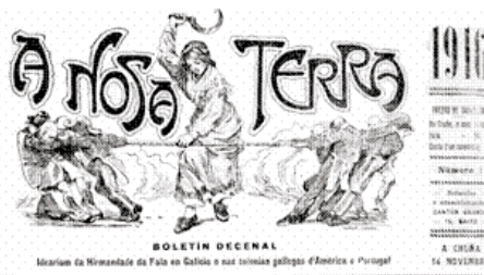
Gravado da cabeceira de A Nosa Terra

Os artigos de calidade cumpren con certos requisitos: ser completo e entendible, estar co-