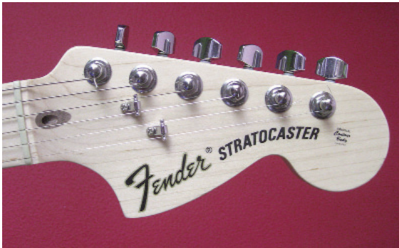
Caravilleiro dunha Fender Stratocaster. Bene Riobó.

Saturno, estrelas de galaxias máis afastadas (incluídas as constelacións xa estudadas polos nosos devanceiros), ou os diferentes foguetes lanzados no século XX ao espazo.