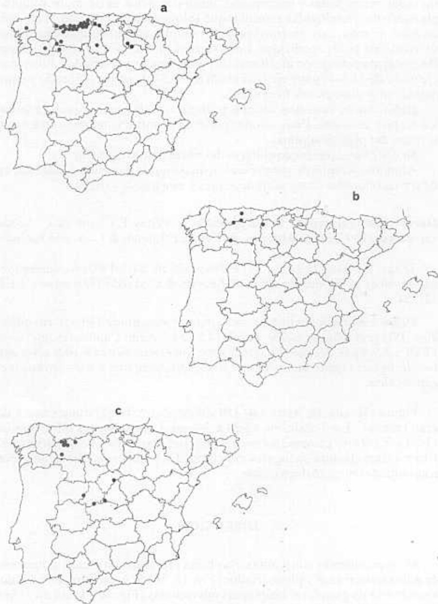
Figura 2.—Distribución del material estudiado: a) Doronicum pubescens , b) D. pubescens var. nemoralis y c) D. carpetanum .