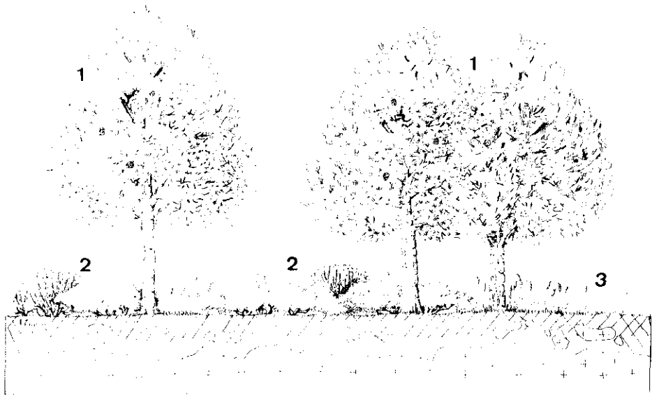
Fig. 2. Estructura y sustrato del Vaccinio myrtilli-Juniperetum nanae : 1. Estrato arbóreo ( Pinus sylvestris , P. uncinata ). 2. Estrato arbustivo ( Juniperus nana , Vaccinium myrtillus , Calluna vulgaris , y Cytisus purgans ). 3. Estrato herbáceo ( Deschampsia flexuosa ssp. iberica ).