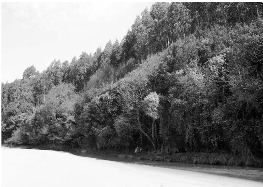
Figura 3.— Aspecto invernal de un lauredal costero silícecola situado en un área abrigada de la costa lucense (desembocadura del Rego de Castrobó, Praia de Abrela, Viveiro, Lugo).

tro del termotipo termotemplado y reciben precipitaciones medias anuales bajas dentro del contexto eurosiberiano en el que se encuentran, ya que se sitúan entre los 800 y 1.000 mm (ombrotipos subhúmedo superior y húmedo inferior, RODRÍGUEZ GUITIÁN, 2004) salvo en las localidades más occidentales, en las que se registra una pluviometría anual media próxima a los 1.500 mm. En la mayor parte de los casos se asientan sobre suelos formados por la alteración in situ de materiales rocosos silíceos, ya sean de tipo metamórfico (pizarras, filitas, areniscas, cuarcitas) o ígneos (granitos y, en menor medida, granodioritas), aunque en algunas ocasiones lo hacen sobre sustratos básicos del denominado “Complejo del Cabo Ortegal” o suelos desarrollados a partir de sedimentos cuaternarios antiguos, como acontece en diversas localidades de las áreas lucense y asturiana de la rasa cantábrica y en la Ría del Eo (IGME, 1982, 1984; ITGE, 1991). A pesar de que en la cartografía geológica de referencia se delimitan diversos afloramientos de rocas carbonatadas en la parte costera del área de estudio, su presencia no parece influir de manera evidente