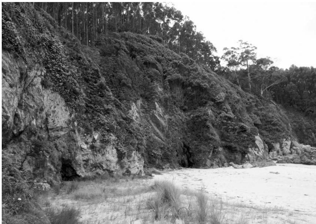
Figura 2.— Lauredal costero silicícola en la parte alta de un cantil costero de fuerte inclinación. Parte W de la Playa de Xilloi (O Vicedo, Lugo).

de la villa de Luarca (Asturias), sobre el que se sustenta la diagnosis de la asociación Calluno vulgaris-Lauretum nobilis . Según los autores citados, en dicho sintaxón se incluyen laurales que contarían, entre otras, con la presencia de especies termófilas ( Smilax aspera , Rubia peregrina , Ruscus aculeatus , Davallia canariensis ), plantas de amplia distribución en bosques templados acidófilos del NW Ibérico ( Hedera helix , Lonicera periclymenum , Omphalodes nitida , Teucrium scorodonia , etc.) y diversos táxones representantes de la flora halófila característica de los acantilados marinos del área geográfica estudiada ( Rumex acetosa subsp. biformis , Silene uniflora , Festuca rubra subsp. pruinosa ). Recientemente, ÁLVAREZ ARBESÚ (2005) ha aportado una tabla con 41 inventarios de laurales tomados en los acantilados de la parte occidental asturiana que confirman tanto la peculiar situación ecológica de estas formaciones vegetales como su composición florística.