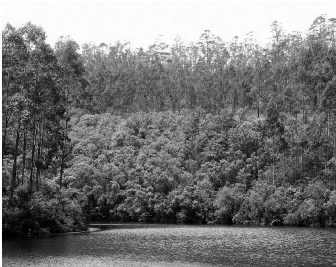
Figura 6. Vista parcial de uno de los extensos madroñales hiperocéánicos existentes en la cuenca del Río Xunco, (Rúa, Cervo, Lugo).

Erica vagans , Cytisus cantabricus , Vaccinium myrtillus , Hedera helix , Teucrium scorodonia , Lonicera periclymenum y Pterospartum tridentatum subsp. cantabricum . Las especies herbáceas más frecuentes son plantas habituales en los matorrales y bosques de su entorno ( Pteridium aquilinum , Rubus gr. ulmifolius , Polypodium vulgare , Holcus mollis , Blechnum spicant , Dryopteris affinis , Solidago virgaurea , Oxalis acetosella ).