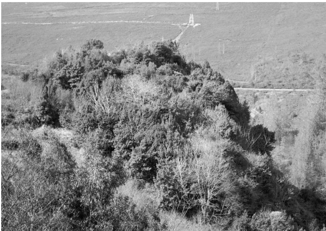
Figura 4.— Lauredal interior calcícola de Penido do Orxal (Mondoñedo, Lugo).

rocas metamórficas ácidas (pizarras, esquistos, cuarcitas, granitos, etc.) y, más puntualmente, ultrabásicas (eclogitas; IGME, 1982, 1984; ITGE, 1991). Sobre estos tipos de rocas se desarrollan, por lo general, suelos muy someros y con abundancia de afloramientos o fragmentos rocosos de gran tamaño (leptosoles y regosoles), en cuyos rellanos se tiende a acumular, debido a su difícil descomposición, la hojarasca del laurel. Como se comentará más adelante, la naturaleza litológica juega en este grupo de lauredales un importante papel como condicionante de su variabilidad florística.