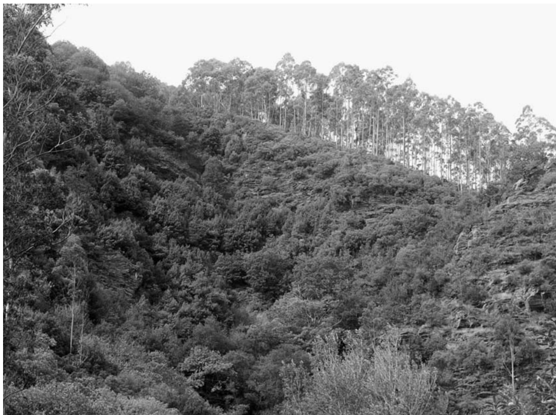
Figura 5.— Lauredal interior silicícola ocupando una ladera pizarrosa abrupta en la cuenca media del Río Eo (Fraga de Foxas, A Pontenova, Lugo).

sativa ). Sin embargo, aún admitiendo una causa humana para justificar la fisionomía que actualmente presentan algunos de los lauredales interiores estudiados, creemos obligado reconocer su carácter de comunidad permanente cuando crecen sobre espolones rocosos fuertemente insolados.