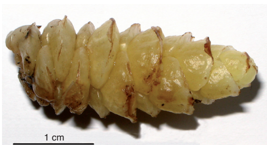
Figura 3. – Fragmento del tallo hipogeo densamente cubierto por hojas apigmentadas.

En las poblaciones estudiadas durante el 2011, la antesis se produjo durante la primera quincena de abril. A últimos de la quincena la mayor parte de las flores inferiores y medias presentan ya la corola marchita, permaneciendo solo 4-6 flores apicales en floración activa. En visitas posteriores vemos la totalidad de las corolas marchitas y los