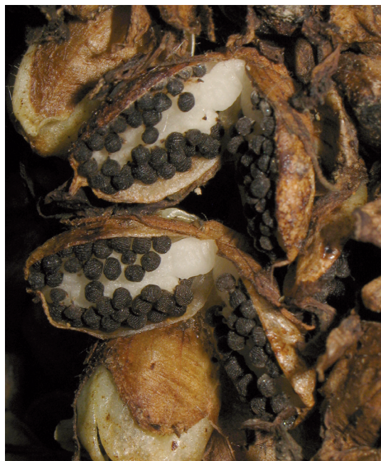
Figura 5. – Dehiscencia de las cápsulas en dos valvas.

L. squamaria necesita bosques caducifolios mesófitos con presencia de hospedador adecuado: Corylus avellana L., Alnus glutinosa (L.) Graertner y otros árboles (BENEDÍ & SORIANO, 2009). Según la bibliografía correspondiente a las localizaciones citadas, parece preferir ambientes nemorales o sub-