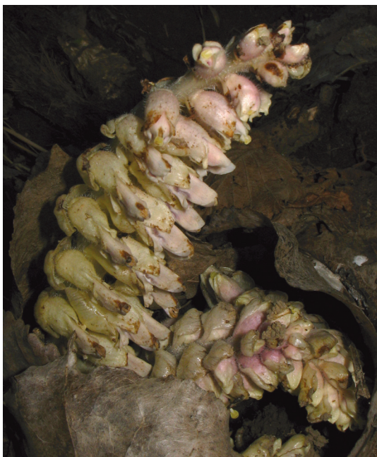
Figura 4. – Emergencia de los brotes florales.

ovarios fuertemente hinchados por el desarrollo de los primordios seminales, proceso que ocupa casi un mes. A mediados de mayo se abren las cápsulas mediante dehiscencia valvar. Los dos carpelos que formaban la cápsula se abren por sus márgenes quedando a menudo abiertos en un mismo plano (Figura 5). Las semillas, negras y rugosas, de cerca de 1mm, aparecen unidas por un corto pedicelo a un eje carnoso.