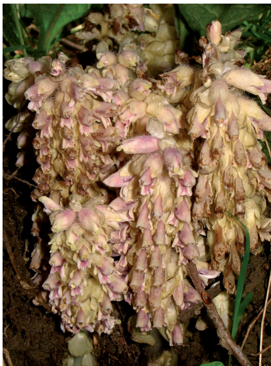
Figura 2. – Agrupación de brotes floríferos.

Los brotes epigeos que emite L. squamaria aparecen generalmente muy agrupados, casi siempre contiguos (Figura 2), formando densos agregados circular-elipsoides de tamaño variable que hemos asimilado como individuos vegetativos diferenciados, de cuyas ramificaciones subterráneas parten todos tallos aéreos floríferos. Se han contabilizado 572 brotes agrupados en 9-10