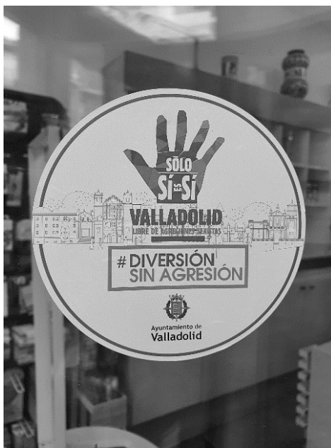
Figura 6. Distintivo de Punto Violeta en una farmacia del centro de Valladolid (2022)