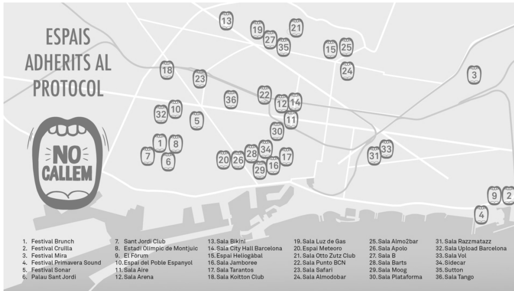
Figuras 4 y 5. Mapa de implantación de “No callem” (“No callemos”) en la ciudad de Barcelona (2019)