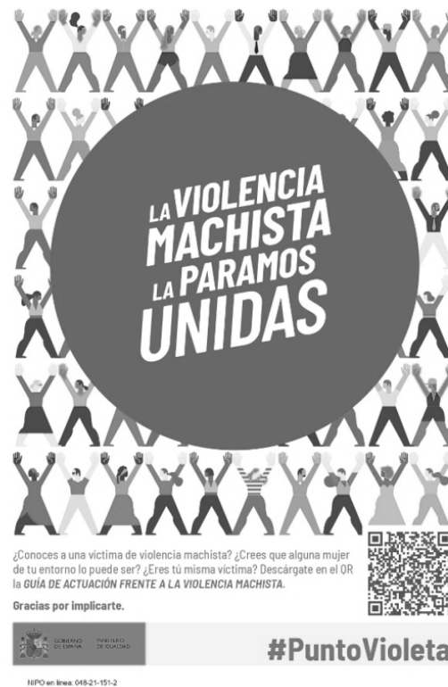
Figura 3. Cartel de Punto Violeta para establecimientos