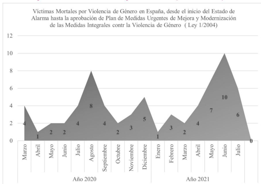
Figura 1. Víctimas de violencia de género durante la pandemia en España