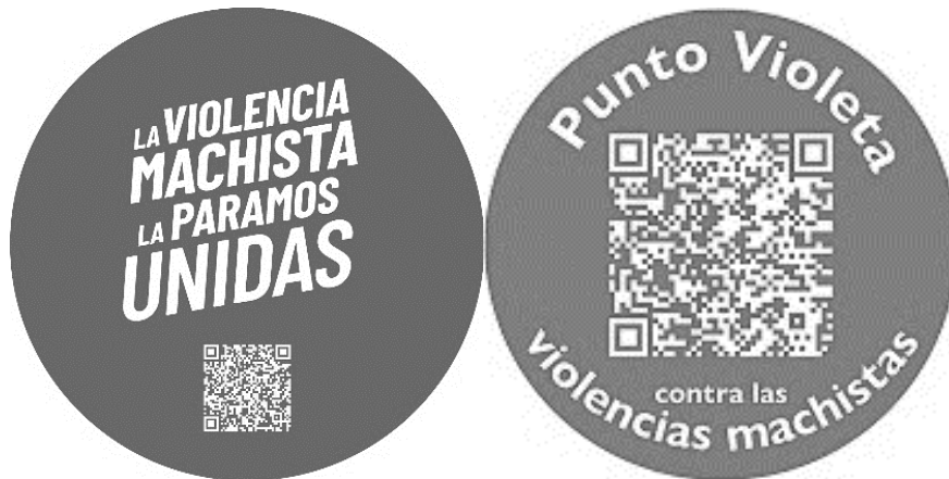
Figura 2. Pegatinas de Punto Violeta para establecimientos