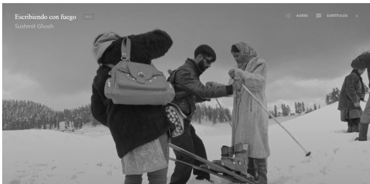
Imagen 2. Por primera vez en todo el film que un hombre se pone al servicio de una mujer

El momento en el que se vive una mayor liberación, empoderamiento y liderazgo femenino es el viaje a Srinagar (Cachemira). Es una experiencia bianual, de las reporteras juntas, un momento para estrechar lazos, reponer fuerzas y dialogar sobre los próximos pasos de Khabar Lahariya. Cabe destacar un plano en el que un hombre se pone al servicio de la mujer, dentro de una pista de esquí (00:50:27). Una situación que parece impensable dentro de la cultura tradicional india.