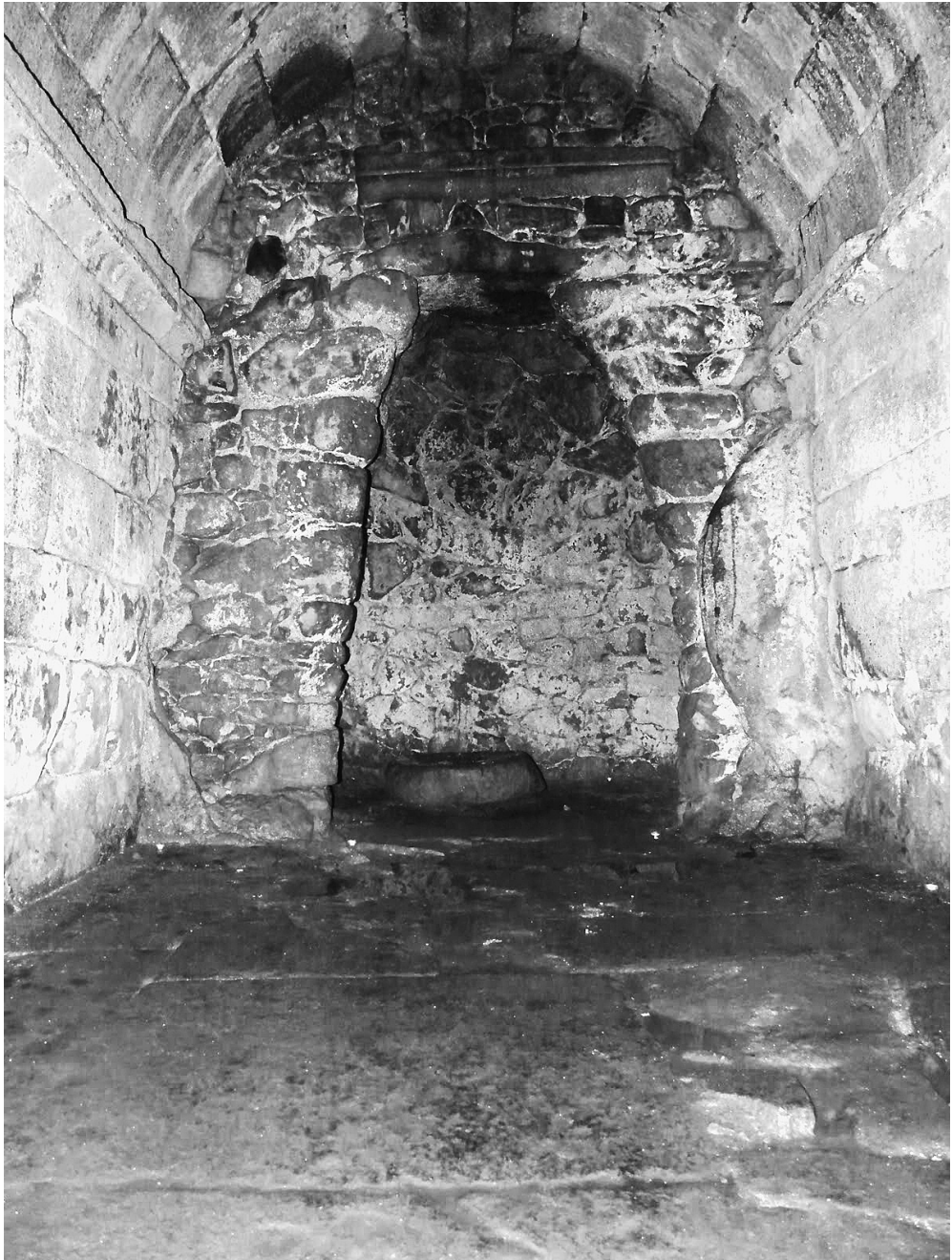
Figura 1. Santa Marina de Aguas Santas: 'Forno da Santa' en el laconicum conservado en la sauna castreña bajo la cripta de la iglesia.