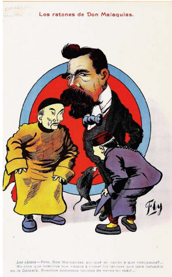
FIGURA 2. Los ratones de don Malaquías

el país de individuos de raza amarilla o mongólica y de raza negra o etiópica». Pese a que no fue considerado por la Cámara, el proyecto tuvo una amplia repercusión en la prensa. Como se aprecia en la imagen 2, a los inmigrantes chinos se los retrataba con su ropa típica (y no occidental), un manejo pobre del español y el consumo de ratas.