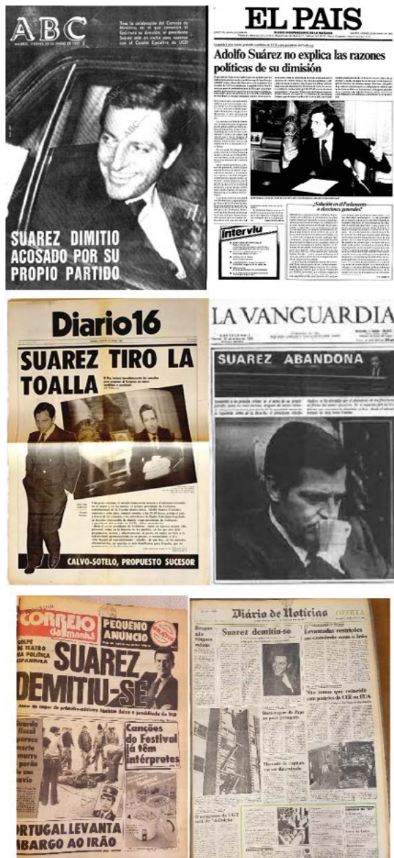
IMAGEN 1. Portadas de ABC, El País, Diario16, La Vanguardia, Correio da manhã y Diário de Notícias