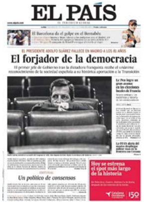
IMAGEN 2. Portadas de El País, ABC, El Mundo, La Vanguardia, Di rio de Noticias y P blico