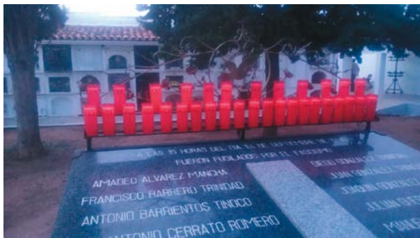
IMAGEN 4. Aspecto del panteón. Detalle