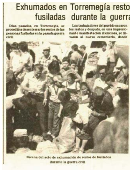
IMAGEN 2. Fotografía de la exhumación en Torremejía

víctimas mortales de la guerra civil» 55 . Ciertamente su partido, la ORT, mostró, al menos a nivel regional, una sensibilidad y una determinación mayores que otros a la hora de impulsar este tipo de iniciativas y, a juzgar por los testimonios recogidos en esta investigación, sus dirigentes parecían estar más concienciados con la reivindicación de la memoria de las víctimas, cuestión que entonces era tildada de radicalismo .