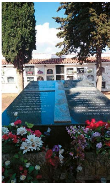
IMAGEN 3. Aspecto actual del panteón