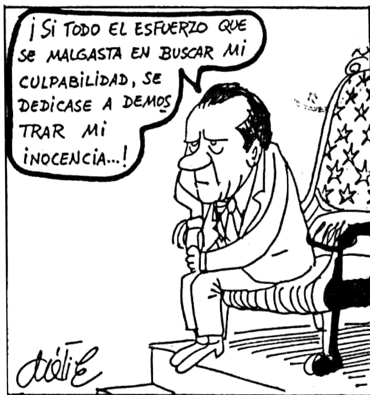
DÁTILE, YA, 13-vii-1974, p. 9.