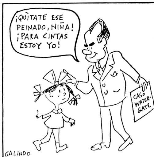
YA, 1-IX-1973, p. 12.