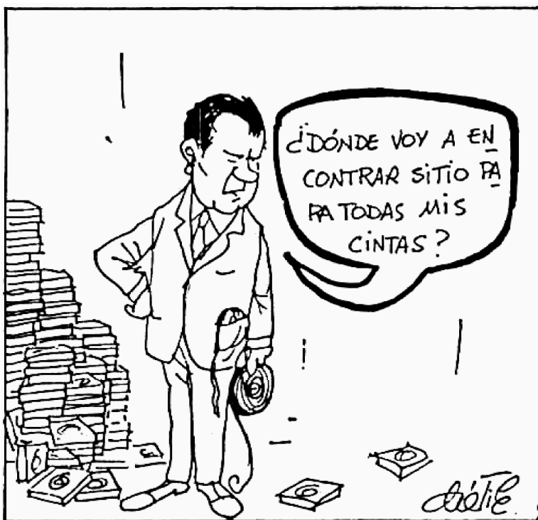
DÁTILE, YA, 9-VIII-1974, portada