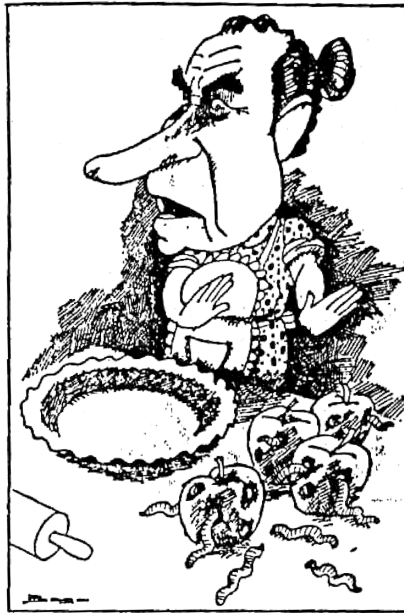
EL ALCAZAR, 24-V-1973, p. 11.