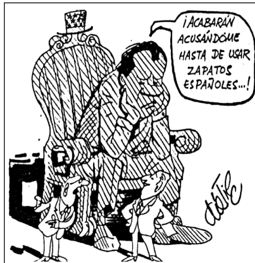
EL ALCAZAR, 24-V-1973, p. 11.