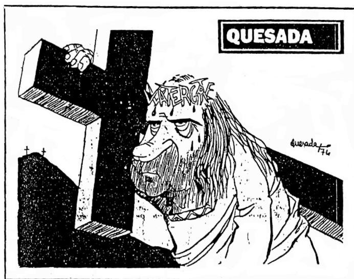
QUESADA, PUEBLO, 8-VIII-1974, p. 11 .