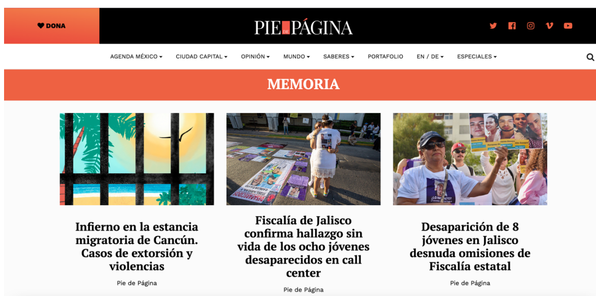
Figura 4. Pie de Página (2023), https://piedepagina.mx/

Desde el comienzo vimos que nuestro principal valor era ser el lugar donde podías publicar cosas que eran complicadas de publicar en los medios tradicionales dominantes. Nosotros no estamos peleando por las primicias. Estamos interesados en ir más a lo profundo, aun si eso significa que tenemos que salir luego de todos. Una de nuestras frases de cabecera es: No lo decimos primero, lo decimos mejor (La Fontaine y Breiner, 2017: 13).