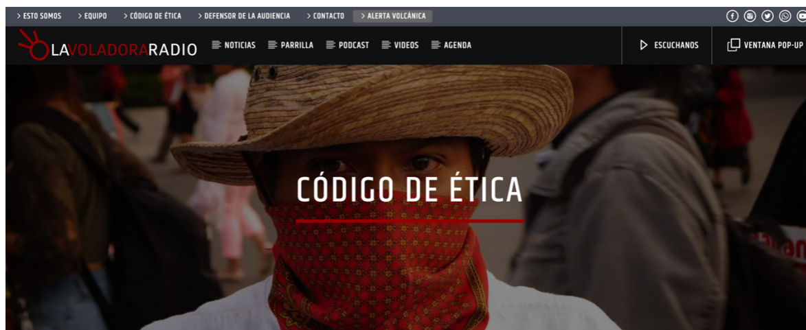
Figura 1. La Voladora Comunicación A.C. (2022), “Código de ética”, https://lavoladora.org/codigo-de-etica/

La desaparición de estudiantes en Ayotzinapa en 2014 y la ola de desinformación y ocultamiento que se generó alrededor del hecho, con la consecuente imposición de la “verdad histórica” oficial, detonó una proliferación de libros y documentales que han buscado esclarecer los hechos y desvelar la verdad en torno a lo sucedido. Un ejemplo es el libro colectivo La travesía de las tortugas , cuyo principal valor es darles voz a los 43 normalistas, contando su vida antes de la noche de Iguala, en un contexto en que habían sido estigmatizados y criminalizados por los medios de comunicación oficiales.