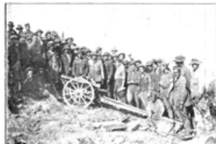
Cañón cogido a los moros en Morro Nuevo, y aquí fue empleado por nuestras fuerzas contra el enemigo