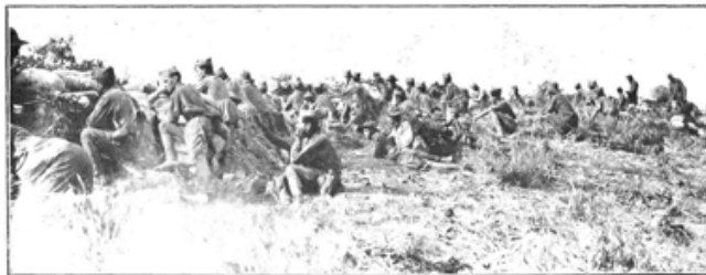
Guerrillas del Tercio contentando con las ametralladoras al enemigo, durante las operaciones de desembarco en la playa de Cebadilla