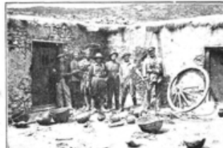
Una de las casas donde vivían los prisioneros capturados en la zona de Alhucemas hasta pocos días antes del desembarco