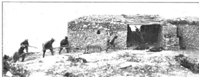
Momento de entrar una compañía de la 6.ª bandera del Tercio, al arma blanca, en una casa en que los moros tenían emplazado un cañón, que fue cogido por los nuestros después de dar muerte a los que lo servían