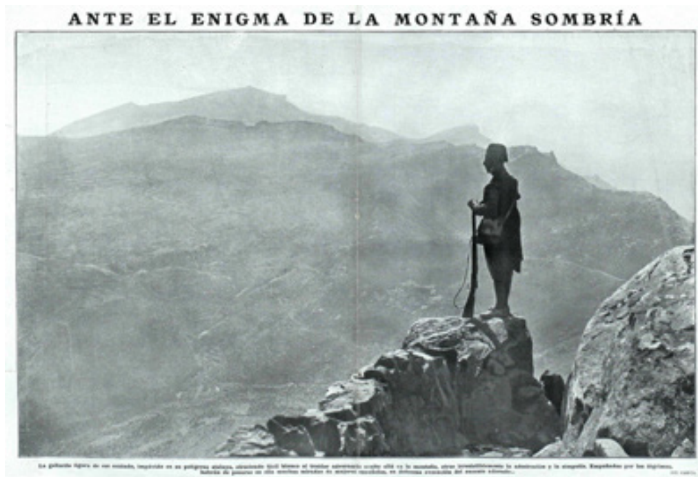
Figura 15. Campúa. Fotografía pictorialista. Doble página de La Esfera , 3 de diciembre de 1921.

Entre 1922 y 1927 volvieron a darse fotos de tipos, costumbres e industria: “Fábrica de harinas de Abraham Levy” y “Compañía de Minas del Rif” (6 de noviembre de 1926). En 1927 solo se publicó el reportaje sobre el viaje de los Reyes a Marruecos (15 de octubre), compuesto por ocho fotos de Díaz Casariego.