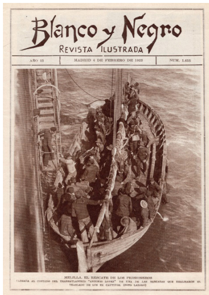
Figura 7. Lázaro. Rescate de los prisioneros de Abd el-Krim. Blanco y Negro , 23 de febrero de 1923.