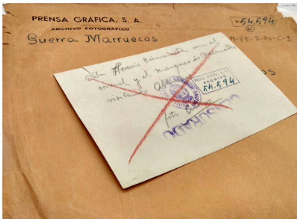
Figura 6. Reverso de una fotografía censurada, procedente de Prensa Gráfica, sobre la guerra del Rif (retrato del empresario vasco Horacio Echevarrieta con autoridades civiles y militares). Medios de Comunicación Social del Estado (AGA).