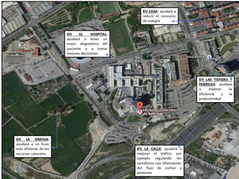
Figura 1: Algunos ejemplos de cómo el Big-data nos afecta y afectará en nuestra vida cotidiana.

Se ha tomado una fotografía de satélite de Google-maps del entorno del Hospital de Bellvitge en Hospitalet de Llobregat (Barcelona) (Basado en un ejemplo citado en “Making Big Data work for Europe”, Comisión Europea. 2014b)