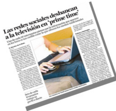
Imagen 1. Notoriedad de las Redes Sociales

Analizado alguna de las redes sociales se pueden encontrar diferencias significativas entre las mismas en función de su objetivo principal. Por ejemplo, Foursquare es una interesante red social que ha conseguido captar la atención de una buena cantidad de internautas últimamente, en gran parte por su estrategia para que los que se registran se animen a seguir activos en el servicio, a diferencia de Facebook y Twitter cuyo objetivo es simplemente conectar a los usuarios con sus amigos y mantenerse actualizado tanto de lo que ocurra en el mundo como lo que ocurra en su círculo de usuarios.