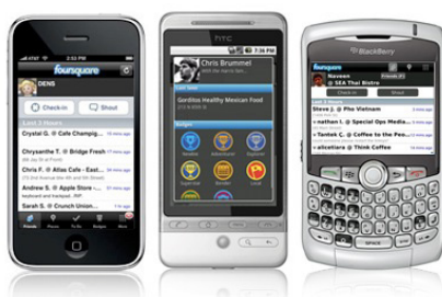
Imagen 3. Dispositivos variados de terminales móviles

Algo positivo a remarcar de Foursquare es que tiene disponibles aplicaciones móviles para prácticamente cualquier teléfono móvil, ampliando tremendamente el