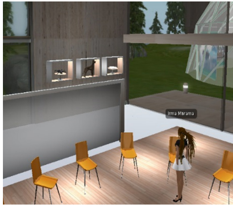
Avatar de alumna del grado en historia.