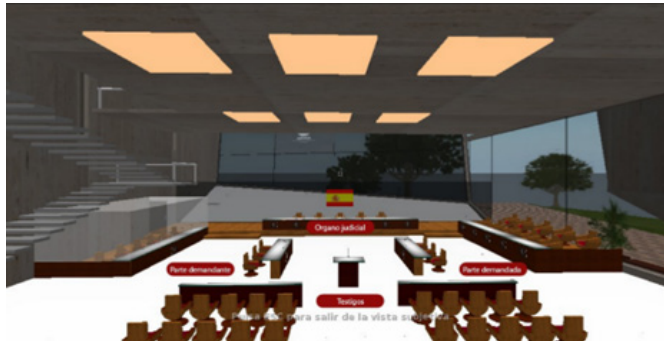
Aula de Juicio en Second Life. 9