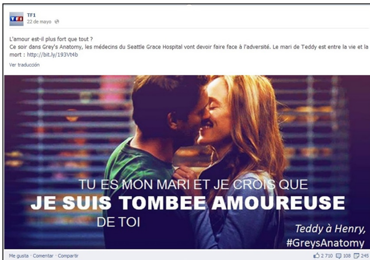
Imagen 2. Captura de pantalla del Facebook de la francesa TF1

En relación a la actividad de la audiencia, los usuarios italianos son los que mayor acogida muestran a los mensajes en Facebook de sus medios (expresada con los “me gusta” en los post ), con un sobresaliente 43,2%, muy superior al 21,1% de los franceses y al 20,9% de los españoles. Algunos medios son especialmente efectivos, ya que con única publicación al día pueden llegar a obtener más de dos mil “Me gusta” como se observa en la Imagen 2. La audiencia italiana es también la más activa compartiendo contenidos, con un 52,2% del total de mensajes compartidos. Por el contrario, la finlandesa es la menos animada con sólo un 0,2% del total.