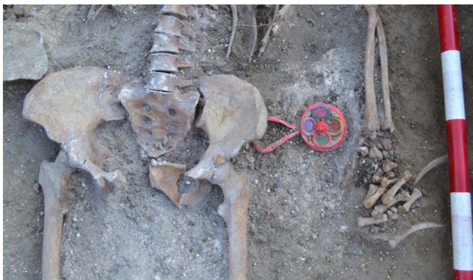
(F3, Sociedad de Ciencias Aranzadi en “El sonajero que sobrevivió a la Guerra Civil”, El País , 8-V-2019)