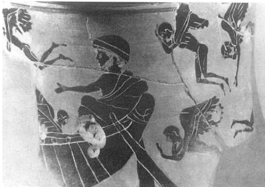
FIG. 2.—Caronte y eidola. Frankfurt Li 560.

hizo para pintar a Caronte en su Nekyia . Otras representaciones de Caronte y eidola algo posteriores ofrecen quizá una pauta de análisis. Se trata de dos obras del pintor del Tymbos , una del Ashmolean Museum de Oxford 547 (G 258) 50 (fig. 4) y otra del Landesmuseum de Karlsruhe (B 2663) 51 (fig. 5). En ambas aparece Caronte dialogando con un eidolon , pero contrariamente a la Mintada el barquero está figurado con rasgos juveniles. Hemos de pensar que en este motivo mitológico iconografía y literatura reflejan tradiciones diferentes 52 , resultando la tradición iconográfica más abundante que la literaria