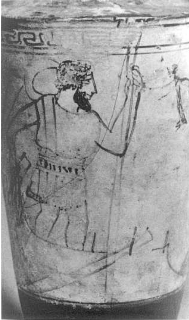
FIG. 5.— Caronte y eidolon. Karlsruhe B 2663. Pintor del Tymbos.