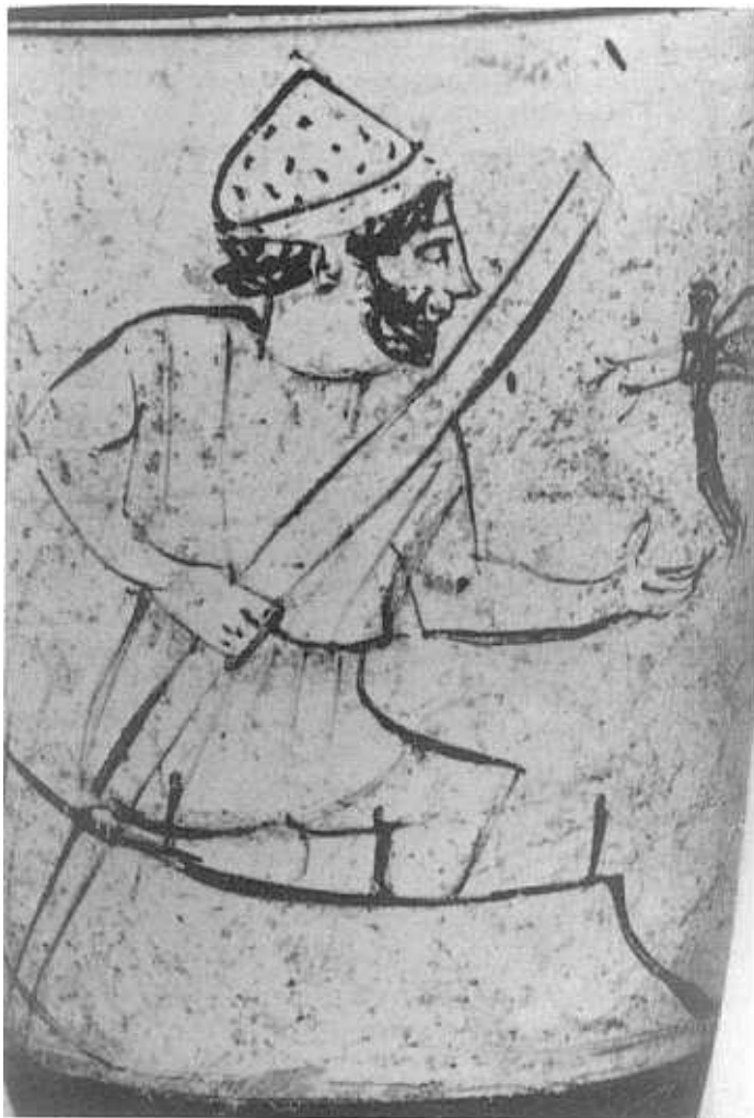
FIG. 4.—Caronte y eidolon. Oxford 547 (G 258) Pintor del Tymbos.

fechas bajas para la aparición de Caronte como barquero en el acervo mitológico griego y, por lo tanto, para la confección de la Miniada .