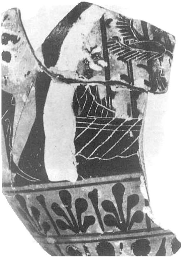
FIG. 3.—Caronte y eidolon. Tubinga, fragmento s 10.1507.

para las narraciones más antiguas del mito. El análisis iconográfico complementa el vacío de la literatura al permitir fechar claramente el surgimiento en el arte del mito de Caronte al filo del siglo V a. C. No es imposible que pudiera existir un desarrollo literario anterior, pero no está constatado. Además, Caronte en su representación como genio barquero benévolo cuadra bien en una sociedad como la ateniense clásica 53 . En este caso todo parece abogar por