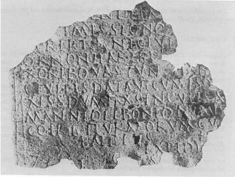
Fig. 2. Cara externa.

El diploma militar presentaba la forma de dos pequeñas chapas ( tabellae ) unidas por dos anillos de metal; éstos pasaban por sendos agujeros a tal fin realizados.