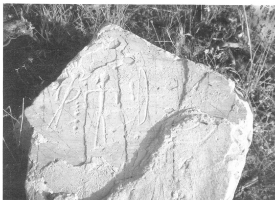
Almadén II o Estela del Mesto (hallazgo in situ )