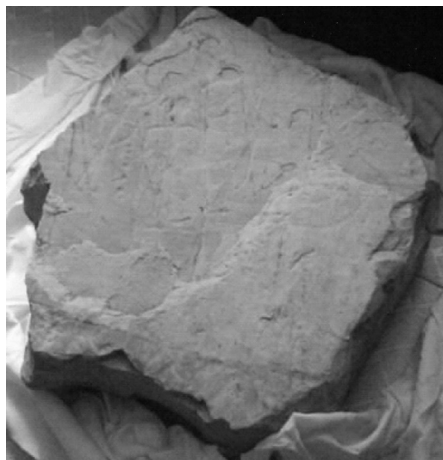
Estela de Almadén II o Estela del Mesto