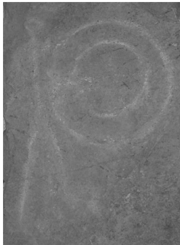
Estela de Almadén I o estela de La Pedrona