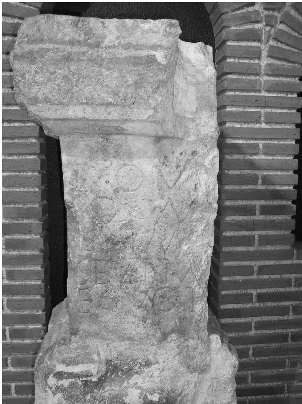
Fig. 2 Vista frontal del ara. Museo Arqueológico y Paleontológico de Salas de los Infantes.