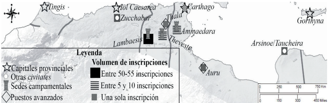
Figura 2. Forma en la que se distribuyen y concentran los monumentos epigráficos de la legio III Augusta con referencias a los lazos de camaradería (elaboración propia)