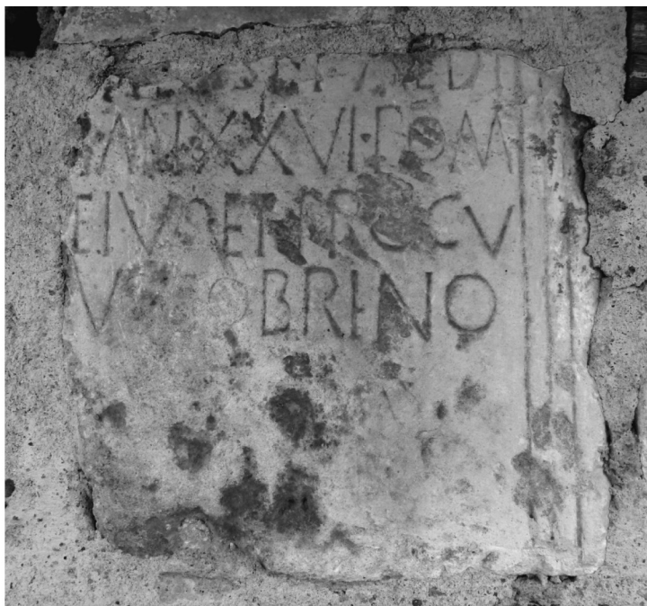
Figura 1. Inscripción de Cubillo del César.

testimonios de similar índole. 4 Entre otras condiciones, la edad de acceso a esta magistratura, según la Lex Malacitana , cap. 54, se estipulaba en 25 años, con lo que atendiendo a ésta, este individuo podría haber ejercido el cargo entre uno y casi dos años como máximo antes de su deceso.