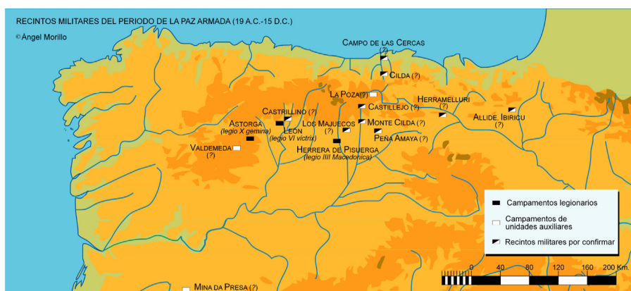
Fig. 4. Recintos militares del periodo de la Paz Armada (19/15 a.C.-15/20 d.C.) (A. Morillo).

Tras el sometimiento final de los pueblos cántabros y astures y tras unos años destinados al control del territorio y a la vigilancia estrecha para prevenir posibles focos de sublevación, se inicia una etapa de mucha mayor trascendencia para la implantación romana en el norte y noroeste peninsulares. Entre el 19 y el 15 a.C. la guarnición asignada a la provincia queda reducida a tres legiones, elegidas por motivos indeterminados entre las que habían participado en las campañas militares. Un conocido pasaje de Estrabón informa sobre la distribución de dichas unidades militares. Un legado se encontraría al mando de dos legiones en el área astur, mientras un segundo legado con una única legión estaba asentado en territorio cántabro. 44 Este alude claramente a la situación a comienzos del reinado de Tiberio, en otro lugar el autor señala que la idea original de esta distribución partió de Augusto. 45 Esta misma noticia es mencionada también, aunque con menor detalle, por Tácito, 46 quien refleja la situación en el año 23 d.C.