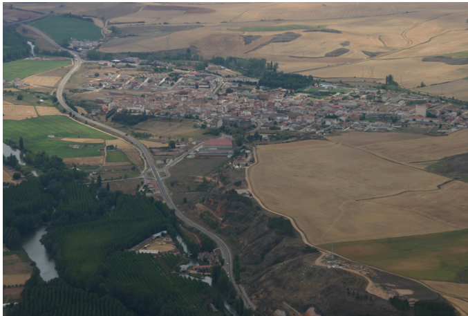
Fig. 5. Fotografía aérea de la localidad de Herrera de Pisuerga donde se puede apreciar su posición en un cerro elevado situado en la horquilla de los ríos Pisuerga y Burejo (A. Morillo).

Todavía conocemos pocos datos sobre la planimetría de la primera fase de este campamento legionario, que contaba sin duda con una estructura defensiva en madera de tipo agger . El campamento se ubicó en un cerro justo antes de la confluencia de los ríos Pisuerga y Burejo, en la zona este del actual casco urbano de Herrera, desbordándolo ampliamente hacia el Mediodía ( Fig. 5 ). Estaba delimitado por su lado oriental por el gran desnivel existente, que se aprovecha como vertedero legionario. El vicus anejo al campamento, del que se conocen algunas estructuras, se situó al otro lado del río Burejo, 58 de donde procede asimismo la tessera hospitalis publicada en su día por García y Bellido. 59