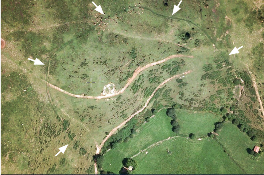
Fig. 2. Campamento romano de Balbona, junto a El Mouro (Didierjean et alii 2014. Fotografía: F. Didierjean).

de acantonamientos posteriores. La identificación de otros recintos como Huerga de Frailes (León) plantea más problemas. 32