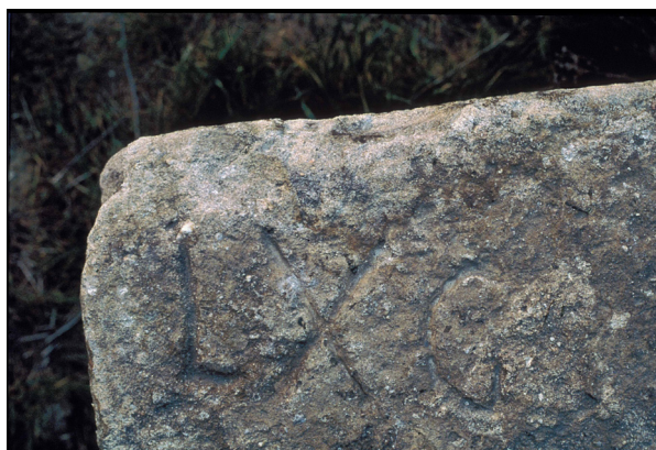
Fig. 6. Sillar de granito con marca L(egio) X G(emina) hallado en Astorga (V. García Marcos).

Las excavaciones en la llamada Casa del pavimento de opus signinum revelaron asimismo restos de estructuras constructivas negativas, practicadas sobre el nivel natural del terreno, a modo de trincheras o zanjas de cimentación, destinadas a albergar durmientes en madera para cimentar construcciones sustentadas mediante postes, cuyas huellas han quedado marcadas sobre el terreno. Dichas estructuras responden a modelos propios de la arquitectura militar romana en madera y quedaron selladas mediante el nivel de relleno donde se concentra la mayor parte de los materiales de la fase militar. 72 El hallazgo de un doble foso del tipo fossae fastigatae , de sección en “V”, perteneciente sin lugar a duda al sistema defensivo del campamento, constituye un argumento decisivo respecto al carácter militar del primitivo asentamiento de Astorga. 73 En las excavaciones en un solar cercano a la muralla bajoimperial se encontraron varios grandes bloques de granito desplazados y reutilizados en una obra posterior. Su importancia radica en que presentan la inscripción L.X.G. grabada en grandes letras capitales cuadradas en una de sus caras mayores, que podemos identificar con la legio X Gemina (Fig. 6).