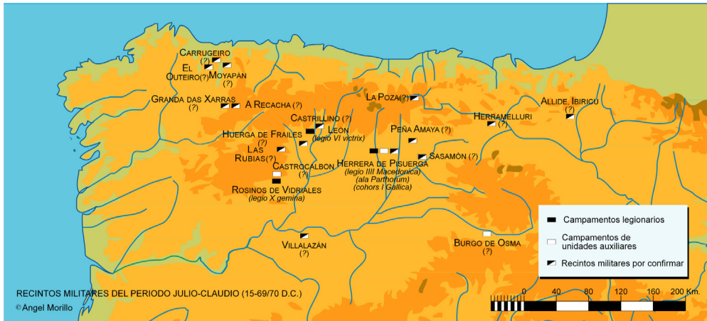
Fig. 10. Recintos militares en Hispania entre el 15/20 y el 68 d.C. (A. Morillo).

Sin duda, una de las consecuencias más visibles de los cambios en el ámbito militar es el abandono del acantonamiento de Astorga por parte de la legio X Gemina , que se traslada a su nuevo emplazamiento en Rosinos de Vidriales en torno al 15 d.C. 114 Sobre el lugar de los antiguos castra se fundará la ciudad de Asturica Augusta , capital del conventus Asturum y primer núcleo civil de importancia en la región septentrional de la Península. 115