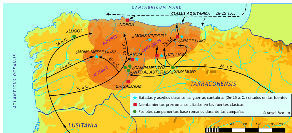
Fig. 3. Las guerras cántabras (26-25 a.C.). Hallazgos arqueológicos y reconstrucción de las campañas (Morillo 2011).

fue objeto de un ataque en tenaza combinada desde la Meseta y las bases militares en territorio galaico. Posiblemente a la vez, e incluso con anterioridad, debieron de someterse los principales oppida de la vertiente meridional de la Cordillera Cantábrica, como Lancia . Finalmente, desde la propia Meseta, se penetró hacia la franja marítima probablemente a través de los pasos naturales de La Carisa y La Mesa. Y no podemos descartar una participación de tropas estacionadas en el territorio galaico en la conquista del litoral occidental astur, ya que las comunicaciones naturales son muy fáciles. 34 (Fig. 3)