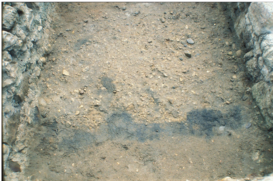
Fig. 9. Restos de uno de los paramentos de madera del vallum del campamento augusteo de la legio VI Victrix (León I) hallados durante la excavación del solar de Santa Marina.

contramos sin duda ante los primeros testimonios del vicus civil anejo al campamento legionario. 84