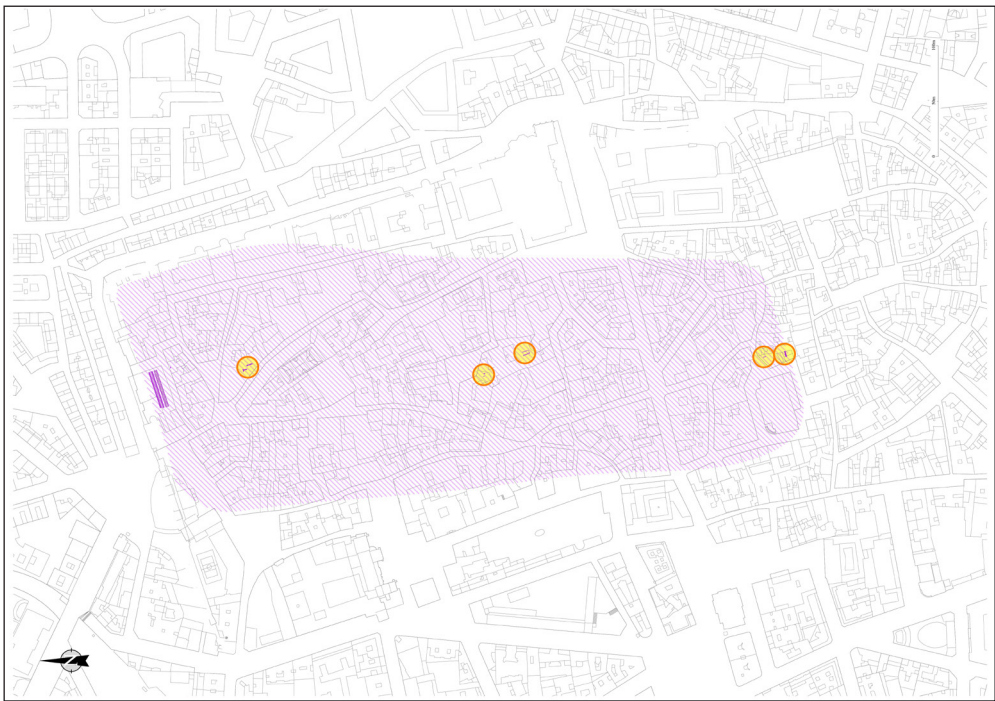
Fig. 7. Extensión hipotética del campamento augusteo de León (León I) respecto al casco antiguo de la actual ciudad. Se indican los restos encontrados pertenecientes al mismo, incluyendo los restos de las defensas septentrionales en el sector de Santa Marina (A. Morillo).

La implantación romana en León se materializó en un lugar que constituye una auténtica encrucijada en las comunicaciones entre la Meseta y la Montaña Central leonesa, que ofrecía por lo tanto unas condiciones topográficas y espaciales de un valor estratégico que, al igual que sucede con otros asentamientos militares augusteos, no debieron de pasar desapercibidas al ejército romano. Se eligió un cerro amesetado alargado dispuesto de norte a sur, que constituye la segunda terraza fluvial del Torío-Bernesga. García y Bellido había establecido los años 74/75 d.C. como el momento de arranque de la implantación romana en el solar de la ciudad de León con el establecimiento del campamento de la legio VII Gemina . 75 No obstante, tanto este investigador como otros posteriores, 76 aportaron diversos argumentos epigráficos y arqueológicos que avalaban la posibilidad de un asentamiento militar anterior.