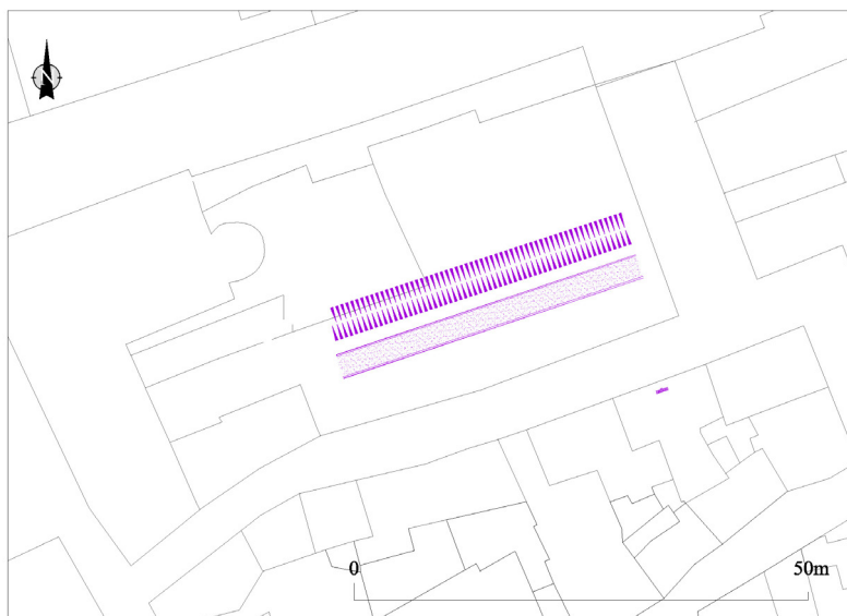
Fig. 8. Reconstrucción de las defensas septentrionales del campamento augusteo de León (León I), compuestas por un foso y un vallum o terraplén del tipo box rampart (A. Morillo).

Quizá el aspecto más importante de los trabajos arqueológicos de los últimos años ha sido la definición de la auténtica secuencia cronoestratigráfica de la etapa romana en León, al menos en sus rasgos básicos, aunque aún faltan por precisar muchas cuestiones de detalle. 77 Pero en la actualidad estamos en condiciones de aseverar que, bajo el campamento de la legio VII Gemina , del que tradicionalmente se ha derivado el nacimiento de la ciudad de León, se encuentran los restos de dos recintos militares precedentes. 78 El primero de dichos campamentos (León I), datado en torno al cambio de Era, todavía plantea numerosas incógnitas, comenzando por su morfología y dimensiones. A juzgar por los restos hallados en Santa Marina, su trazado parece coincidir desde el punto de vista topográfico a grandes rasgos con los posteriores, al menos en el sector norte. Sin embargo, no ha podido ser delimitado por el resto de sus lados, especialmente los laterales este y oeste ( Fig. 7 ). 79