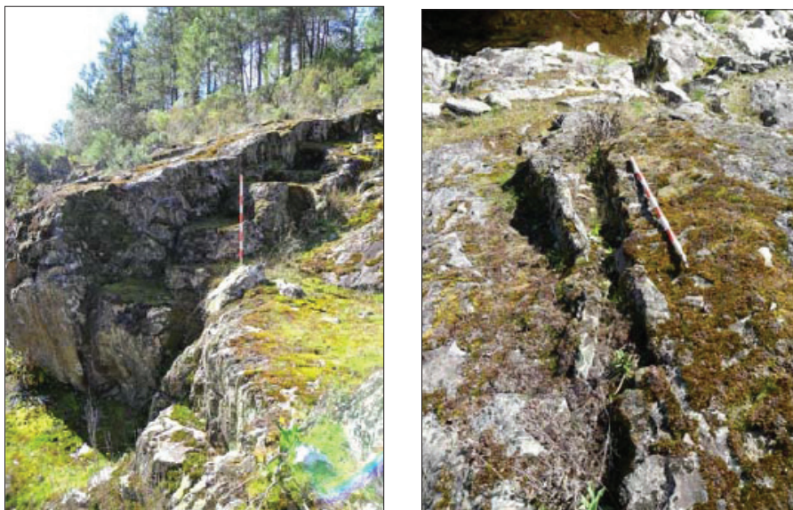
Figs. 6 y 7