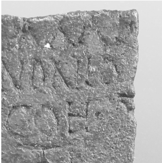
Fig. 2. Fotografía de detalle de la hendidura ( extrinsecus , línea 3)

parte de una letra (Figura 2). Como se trata de demostrar a continuación, se trataría del numeral I, correspondiente a la cohorte I Ulpia Dacorum .