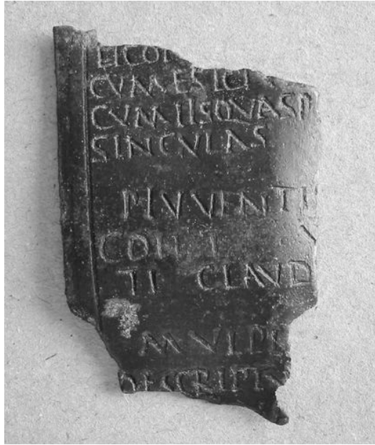
Figura 3. Fotografía del diploma AE 2001, 2153

militar, en torno al 128/129, llegaría el momento de terminar su servicio militar. 17 En consecuencia, el presente fragmento podría corresponder a un licenciamiento de dacios en el frente parto anterior al de 22 de marzo 129 d. C. del que, como se ha señalado, se conocen abundantes testimonios y que se ha considerado hasta la fecha el primero de esta cohorte.