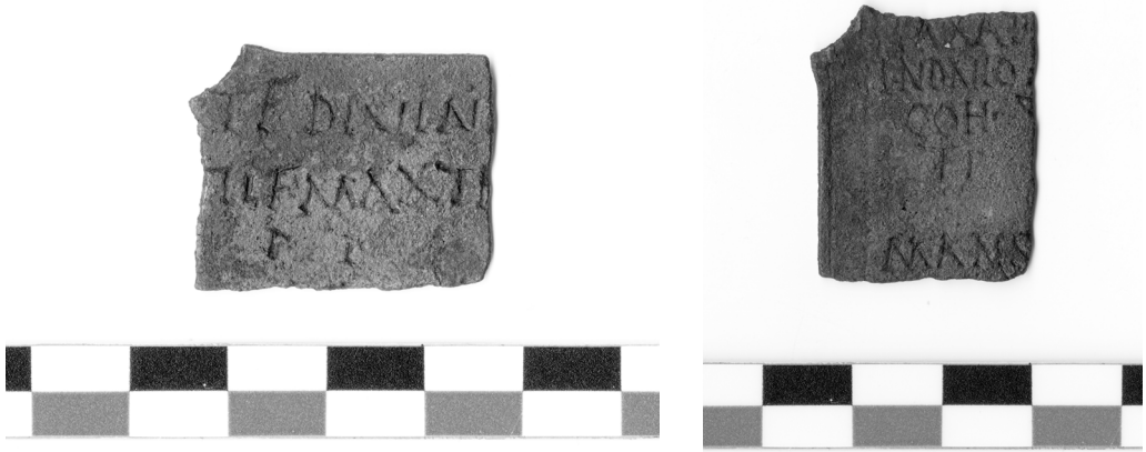
Fig. 1A-B. Fotografía del fragmento de diploma militar ( intus : izquierda; extrinsecus : derecha)

La pieza en cuestión es un fragmento de diploma militar de dimensiones reducidas (2,5 x 3,1 x 0,1 cm). Su estado de conservación no es óptimo, ya que la superficie está desgastada y presenta oxidaciones verdosas; pero el escaso texto conservado no plantea problemas de lectura. La erosión de los bordes apunta a que el recorte de esta pieza no ocurrió recientemente. Las letras miden 0,4–0,5 cm de altura en el intus y 0,3 en el extrinsecus . El interlineado del intus mide 0,3–0,4 cm; el del extrinsecus , 0,1 cm. Solo se conserva una interpunción en la línea 3 de la cara exterior.