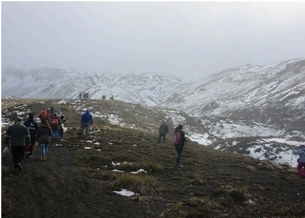
Figura 2. Expedición hacia el Glaciar Pichillanchue organizado por comunidades mapuche aledañas al Parque Nacional Villarrica