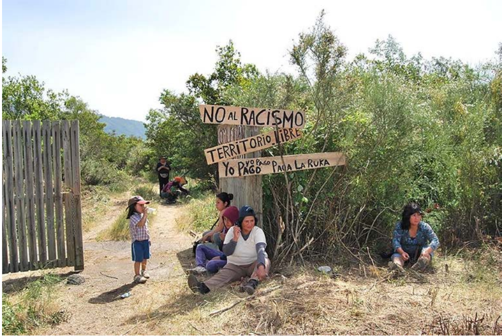
Figura 1. Espacio recuperado por parte del lof Traitraiko destinado al turismo