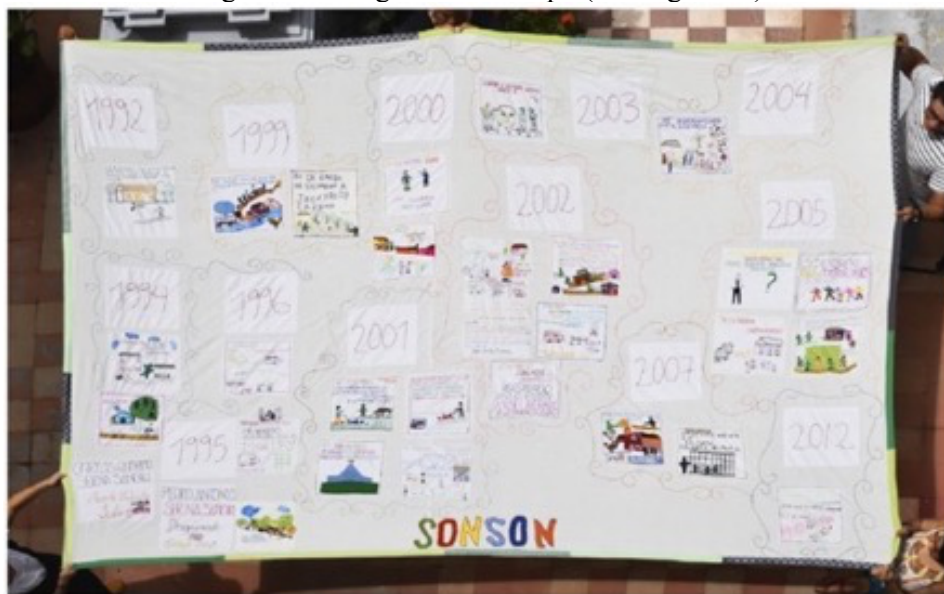
Figura 4. Cartografía del tiempo (Plano general)

Fuente: fotografía por Laura Junco, 2019. Disponible en González-Arango (2020).