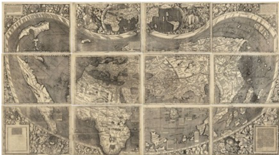
Figura 1. Planisferio de Martin Waldseemüller (1507)

una transformación importante que la pondrá en el escenario estratégico del proceso colonizador. Dos etapas, por lo menos, son claves allí: la primera tiene que ver con la elaboración de mapas que mantenían la representación del mundo conocido por el cartógrafo, pero que comienzan a vincular las nuevas tierras de ultramar (Figura 1). Estos mapas representaban los territorios descubiertos como tierras incógnitas, donde habitaban seres monstruosos, comunidades caníbales, entre otros, producto, a su vez, de las representaciones que los viajeros hacían de dichas tierras.