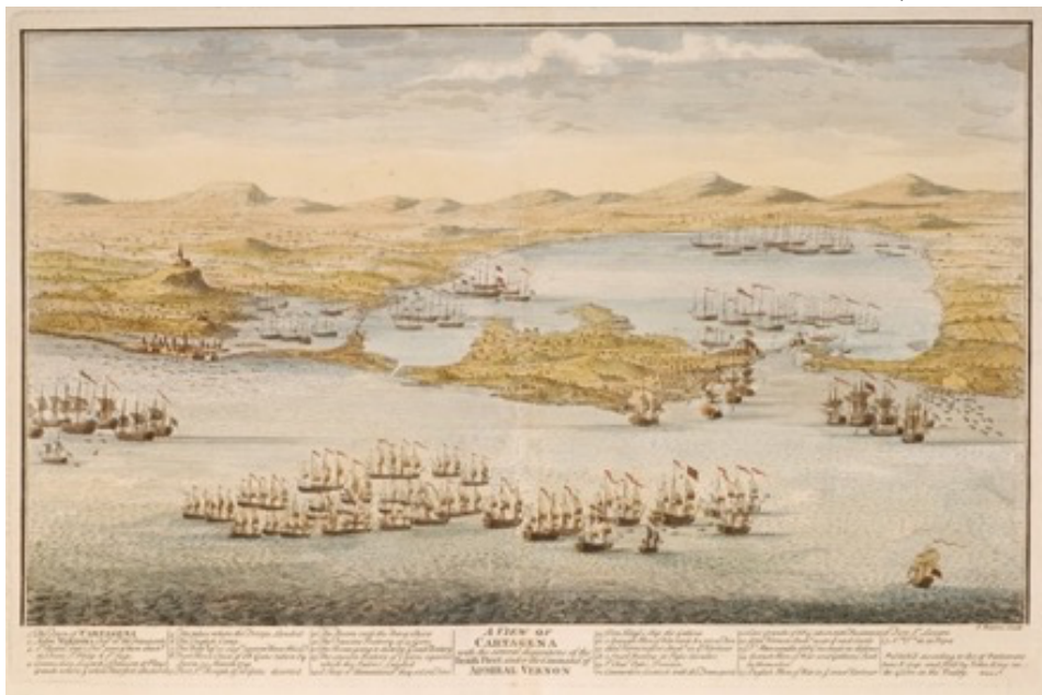
Figura 2. Una vista de Cartagena con las diversas disposiciones de la flota británica al mando del almirante Vernon. Isaac Basire. Londres 1741

La geografía y la cartografía se fueron consolidando como formas de administrar y construir un orden social y natural. Siguiendo a Ángel, Arbeláez y Olate (2010), los mapas han posibilitado movilizar el mundo o parte de este en dispositivos planos a escala humana o poner el territorio en una mesa de trabajo, lo cual los posiciona como objetos políticos desde donde puede proclamarse la posesión y control a distancia de los territorios. Así, los mapas vienen a ser actos de clasificación, ordenación y nominación que incluyen y excluyen, a su vez que permiten ejercer dominación. Más que dibujar la realidad, la cartografía la anticipa convirtiendo al mapa en un poderoso instrumento de control y planeación.