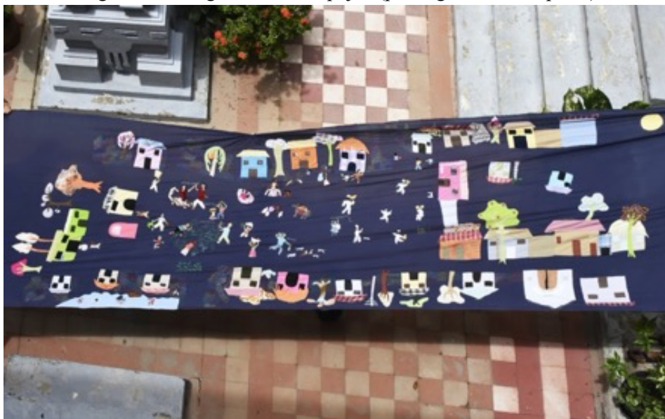
Figura 5. Cartografía de Mampuján (plano general de la pieza)