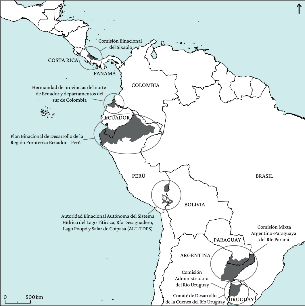
Figura 6. Estructuras de CTF establecidas.

En estos años, también se inició un acuerdo de colaboración con la ALT-TDPS, entre Bolivia y Perú, que está resultando muy fructífero. Desde entonces, se han sucedido diversos proyectos, unos financiados con fondos europeos y otros con fondos propios de la ALT-TDPS, tal y como se referirá más adelante. Asimismo, comenzaron los trabajos con ambos capítulos del Plan Binacional Ecuador-Perú, y se desarrolló el proyecto Cross-Border Regional Innovation Systems at the Brazilian-Peruvian Border Area (CBRIS), que incluyó varios seminarios de formación en el terreno y una visita de estudio a Europa, además de una Conferencia Final celebrada en Lima (ARFE e INFYDE, 2015). También se han llevado a cabo actividades en el marco de programas de cooperación internacional para el desarrollo, financiados tanto por la UE –EUROSociAL y ADELANTE–, como por varias agencias autonómicas españolas.