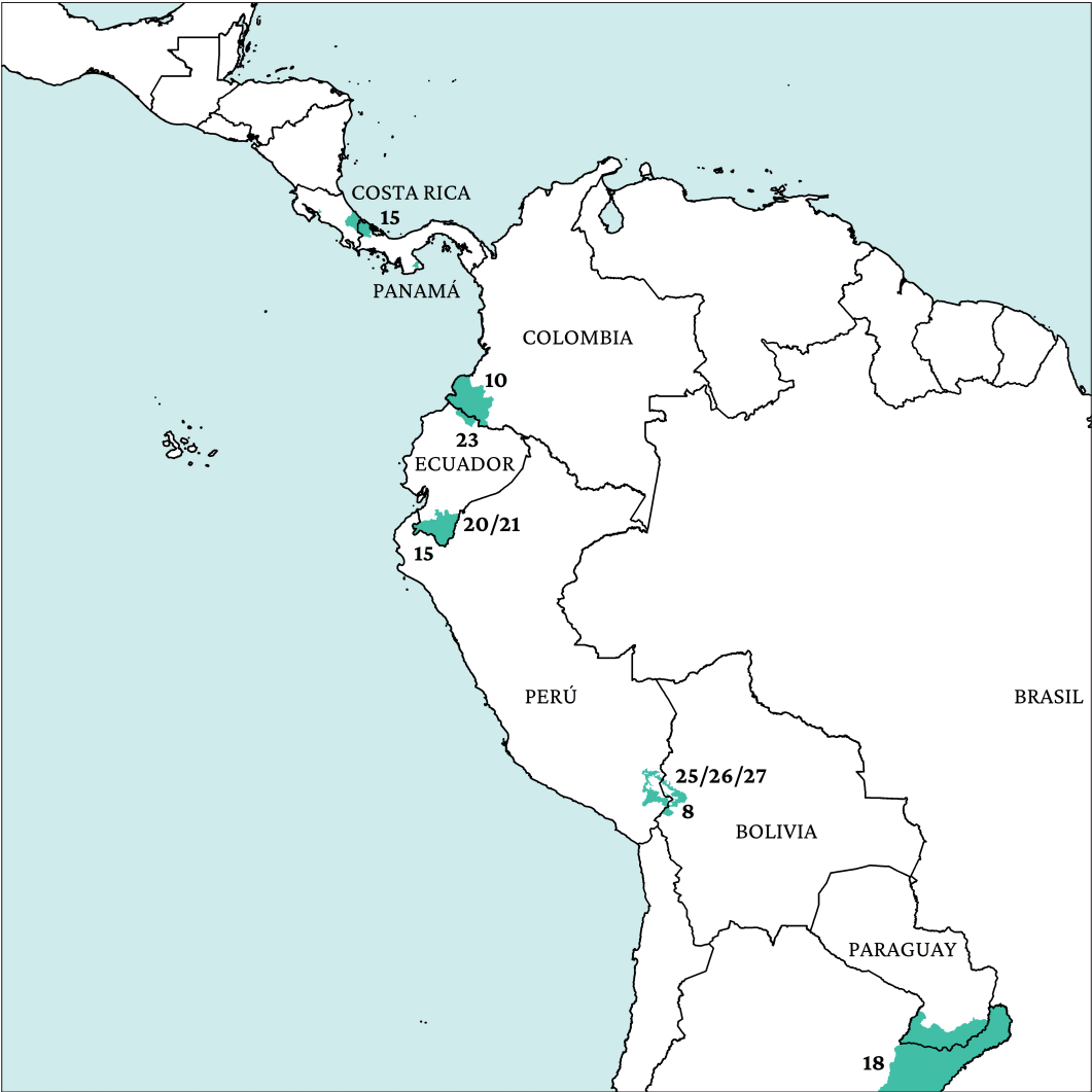
Figura 11. Proyectos de sostenibilidad ambiental.