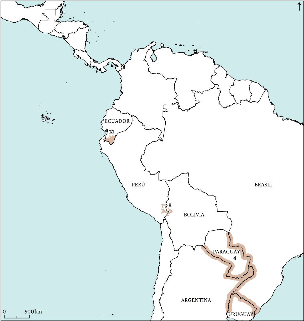
Figura 13. Proyectos de servicios públicos.