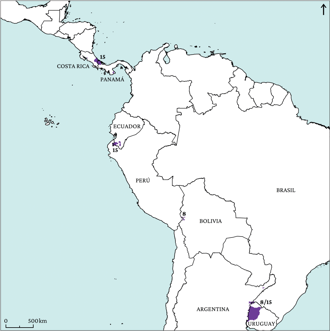
Figura 7. Grado de intensidad de CTF alta 5 .