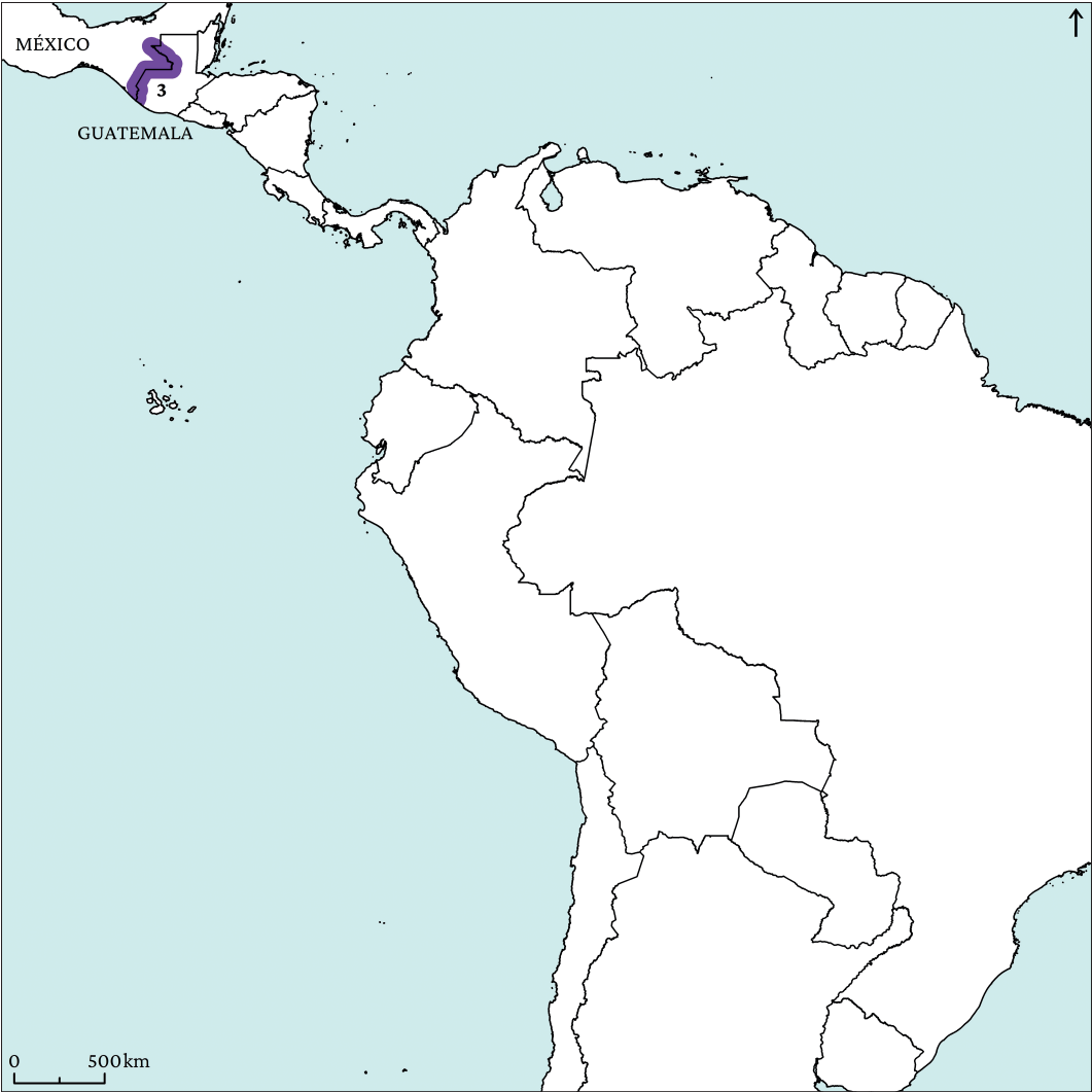
Figura 14. Proyectos de cohesión social y migraciones.