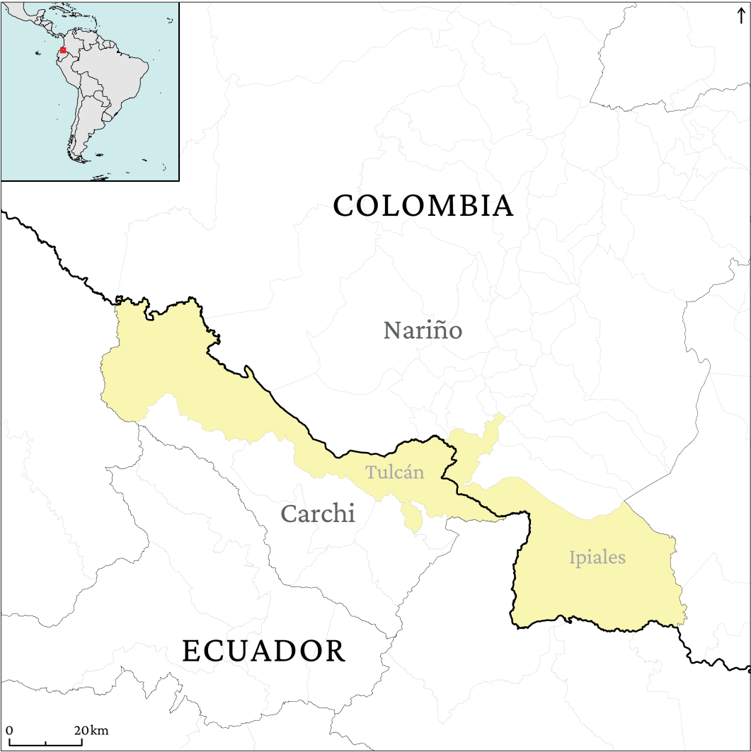
Figura 5. Proyecto liderado por el Gobierno Autónomo Descentralizado de Tulcán (número 16 del Anexo V).

La participación de la ARFE en proyectos en el entorno andino se reforzó en 2016-2017, durante la elaboración de la ya referida Plataforma Andina de Cooperación Transfronteriza (2016-2017) en el marco del programa INPANDES. Su objetivo principal era contribuir a la integración fronteriza de los países de la CAN, incidiendo en las políticas y en la gobernanza locales mediante la participación activa de la sociedad civil. En este marco, la ARFE ha prestado una especial atención a la frontera entre Ecuador y Colombia, donde se está produciendo un proceso de integración fronteriza subestatal gracias a La Hermandad , una alianza entre los cuatro gobiernos autónomos descentralizados provinciales del norte de Ecuador (Carchi, Esmeraldas, Imbabura y Sucumbios)