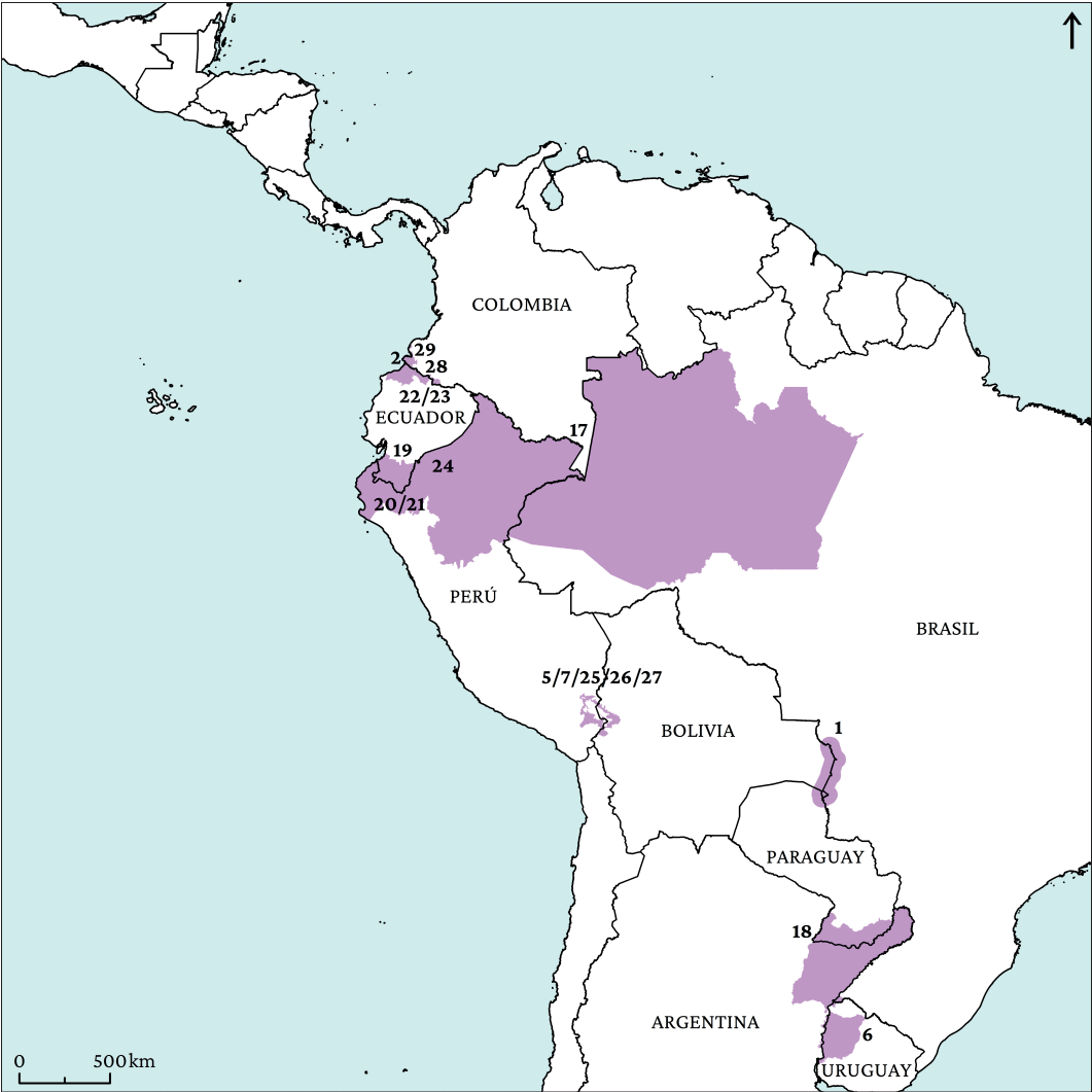
Figura 8. Grado de intensidad de CTF media.