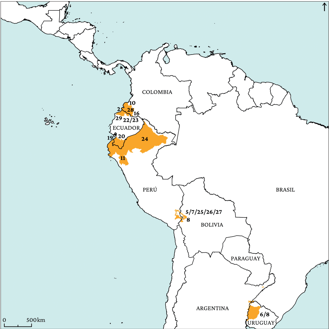
Figura 10. Proyectos de cooperación institucional.