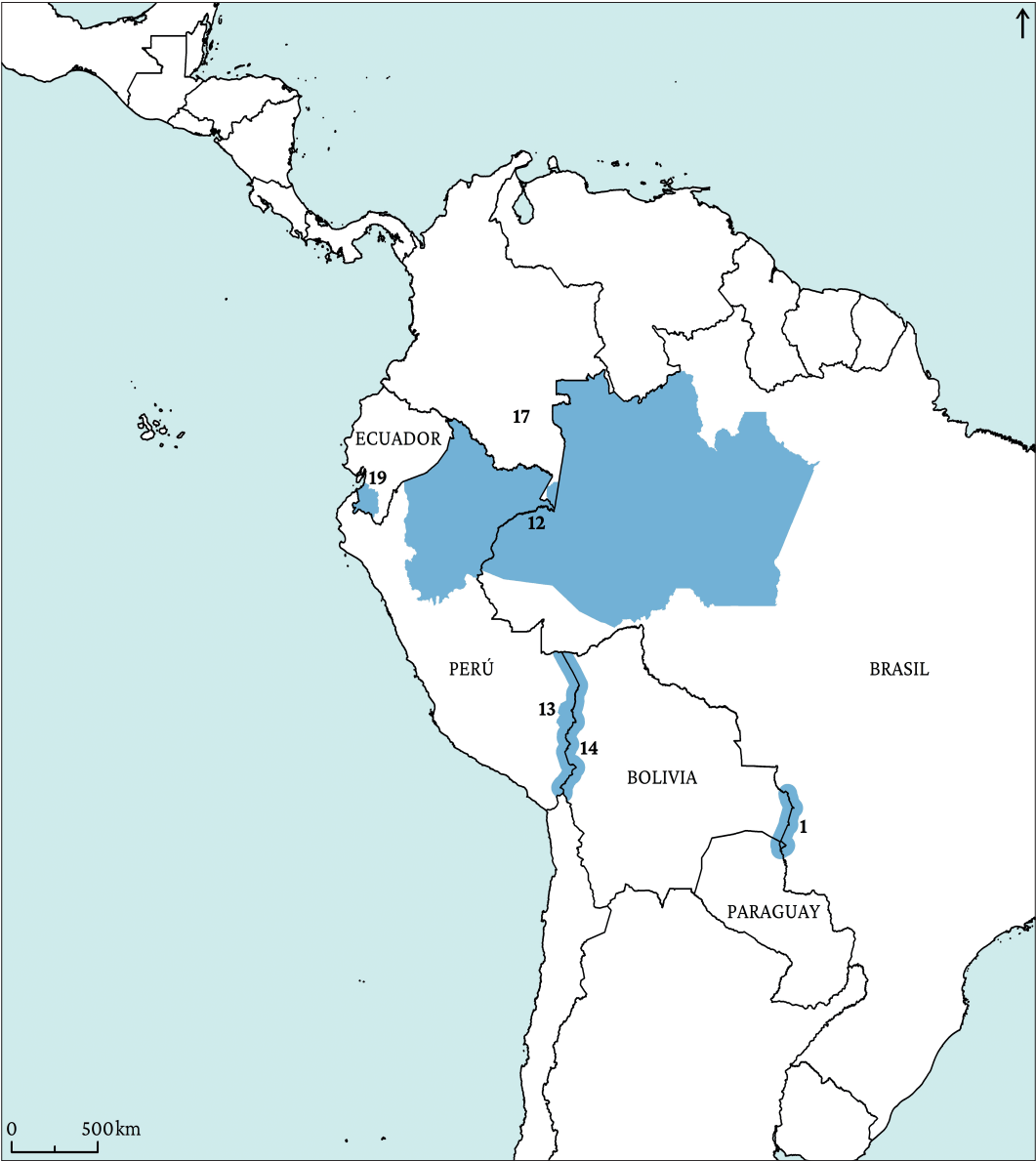
Figura 12. Proyectos de desarrollo económico y productivo.