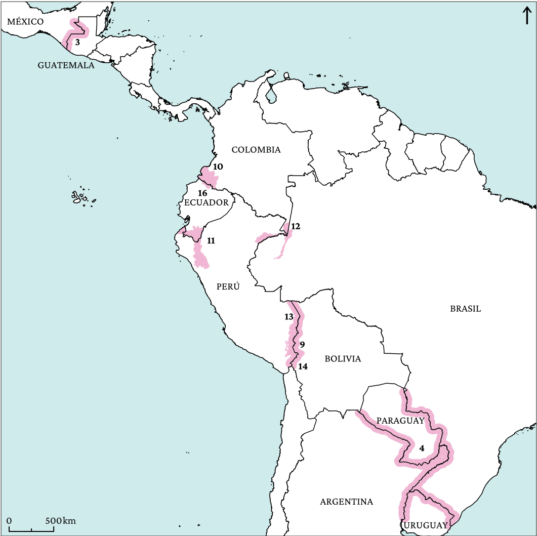
Figura 9. Grado de intensidad de CTF baja.