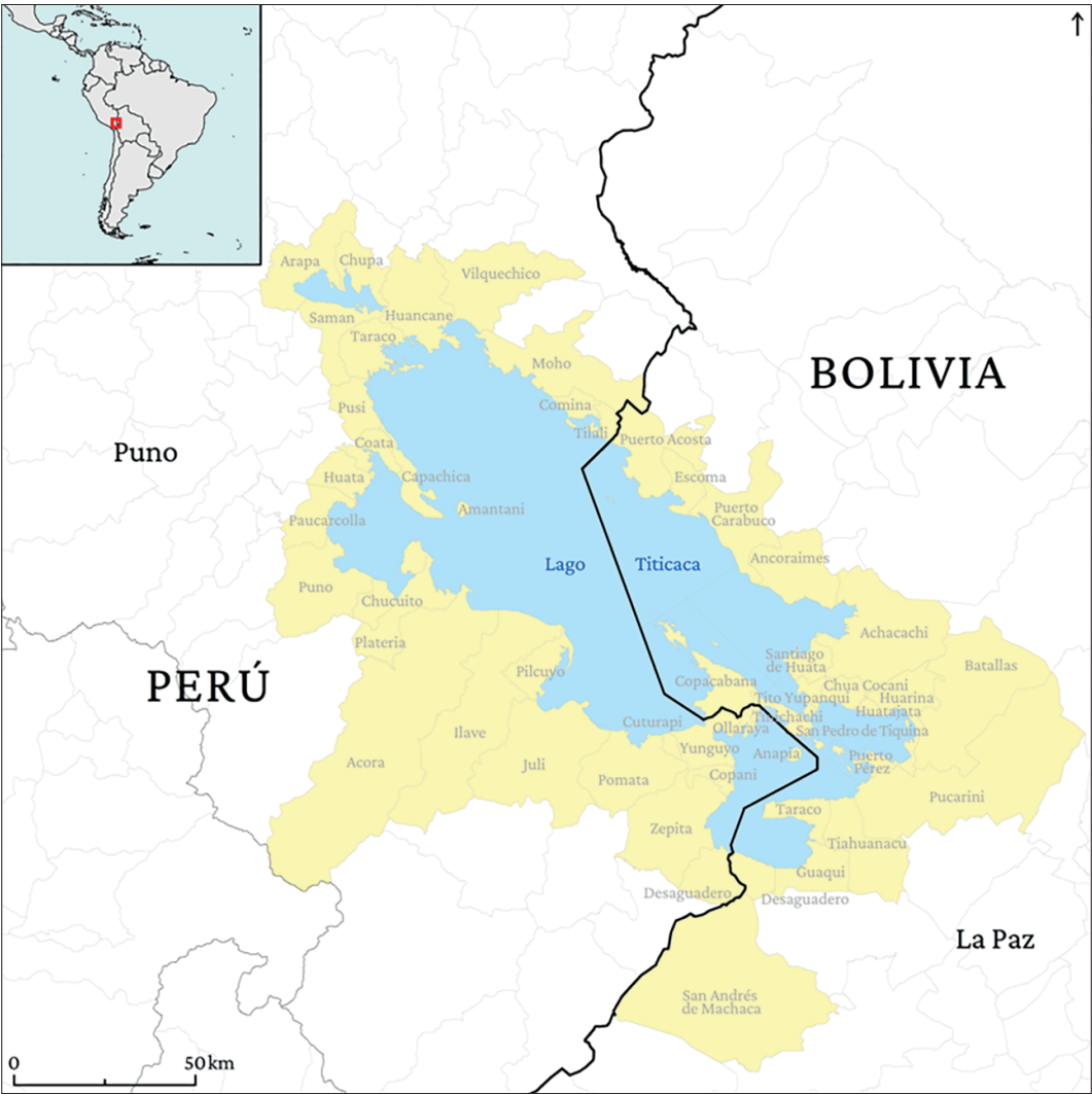
Figura 15. Área de cooperación ALT-TDPS.