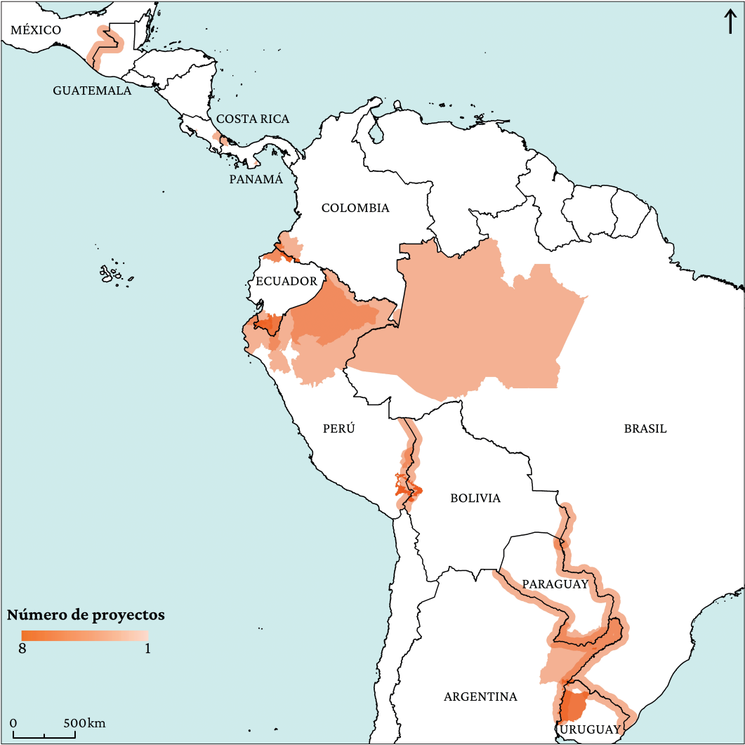
Figura 3. Superposición de los proyectos estudiados.

Una síntesis de la recopilación de la información referida a los 29 proyectos estudiados se facilita en el Anexo V. Ofrecemos a continuación los resultados principales de la investigación en forma