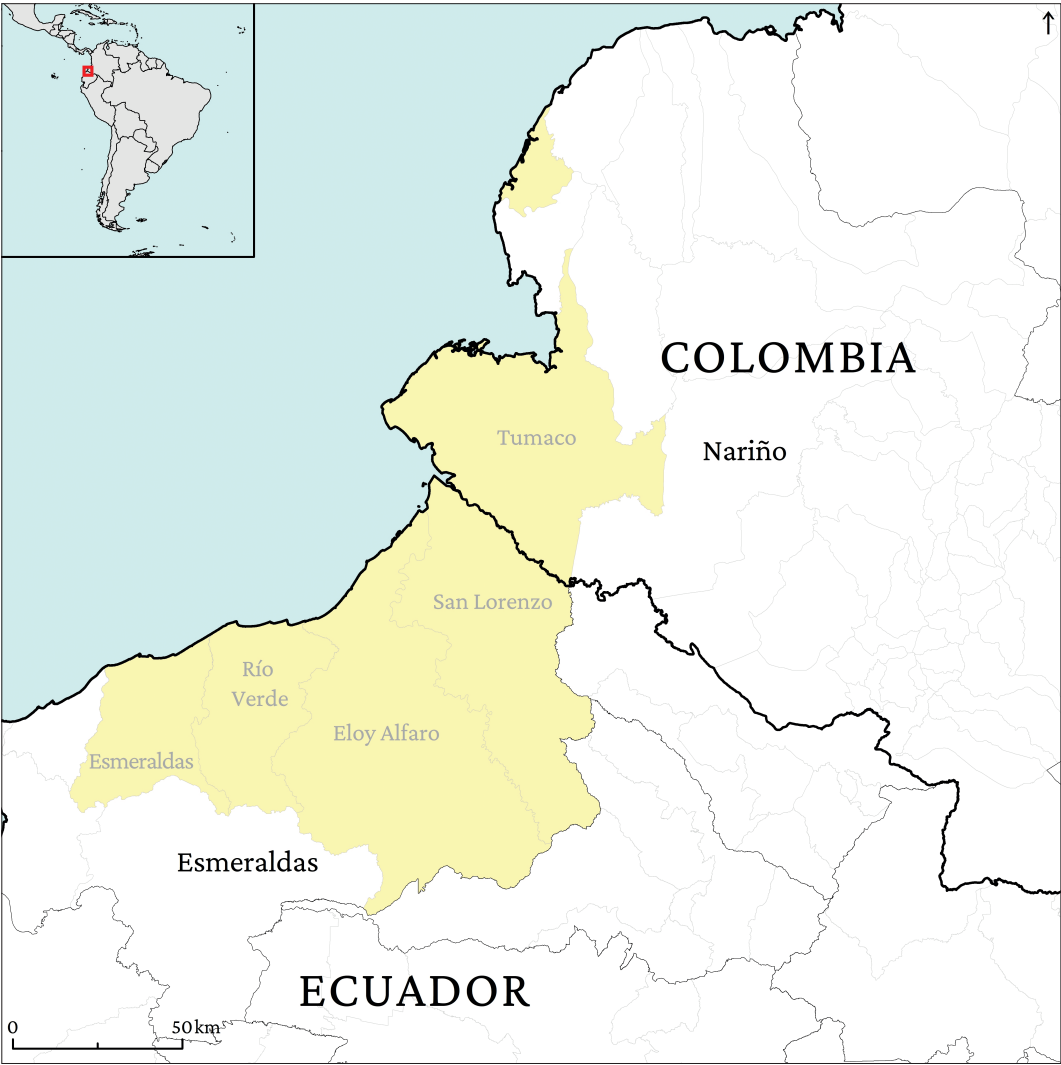
Figura 4. Proyecto liderado por el Gobierno Autónomo Descentralizado de la provincia de Esmeraldas (número 29 del Anexo V).

Inferimos que las fronteras Ecuador-Colombia, Ecuador-Perú, Perú-Bolivia y la tétrada Argentina-Uruguay-Brasil-Paraguay concentran las actividades desarrolladas estos años. En efecto, ya en 2011-2012 la Comisión Europea apoyó a la ARFE, en colaboración con la Comisión Mixta Argentino-Paraguaya del Río Paraná, para llevar a cabo una actuación muy concreta centrada en las capacidades operativas de los actores locales a lo largo de un tramo de esta cuenca internacional (ARFE, 2012). En este sentido, a partir de varios contratos de la ARFE con DG Regio, referidos en la introducción («Cooperación UE-América Latina sobre CTF en el marco de la Política Regional»), se identificaron dos espacios transfronterizos con mucha actividad. Por un lado, la enorme voca-