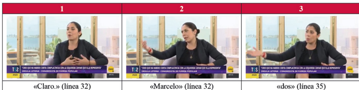
Figura 3. Cambios en la gestualidad de la PE durante la animación.

es, hablar como si fuese otra persona, lo que suele hacerse de modo tal que la co-participante reconozca la animación en virtud de los «cambios léxico-gramaticales en los anclajes deícticos [(p.ej.: «Claro. Te decían “Oye»)] ... cambios en la mirada, expresiones faciales, prosodia, postura, y/o gestualidad [(p.ej.: Figura 3)]» (Cantarutti, 2022, pp. 205-206).