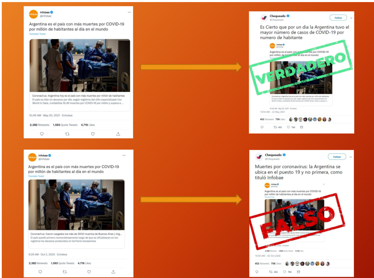
Figura 1. Tuit original (izquierda) y adjudicación “verdadero” o “falso” (a la derecha)

Nota: La figura muestra el tratamiento cuando la autoridad que emite el tuit original es Infobae . Otras rotaciones utilizaron el mismo tuit, aunque alteraron (rotaron) las autoridades de dicho posteo entre Página|12 , La Nación y Clarín .