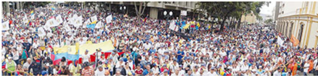
Barquisimetanos desfilaban en la carrera A7 con calle 20