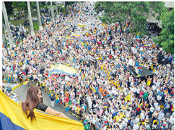
Barquisimetanos desfilaban en la carrera A7 con calle 20

En Barquisimeto, la manifestación que tuvo como punto final el Edificio Nacional, transcurrió con total normalidad. En la carrera 17 con calle 25, se escucharon gritos, canciones, cánticos, palmas, percusiones y estandartes, quienes se pronunciaron sobre la crisis nacional. Mientras el Presidente Maduro firmaba en Cadera Nacional el decreto para la Constituyente, sonaron los cánticos en rechazo a la acción. Nada a la oposición al decir: “¿Quiénes dialoga? (...) ¿Quiénes negocian? (...) ¿Quiénes negocian? (...)” Se espera que el Parlamento sancione este martes.