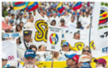
La CVT marchó desde la Catedral hasta el Edificio Nacional

El presidente de la Asamblea Nacional, Julio Borges, convocó a tomar Venezuela desde muy temprano. “Llamamos a rebelarse al pueblo y no aceptar este golpe de Estado”, dijo