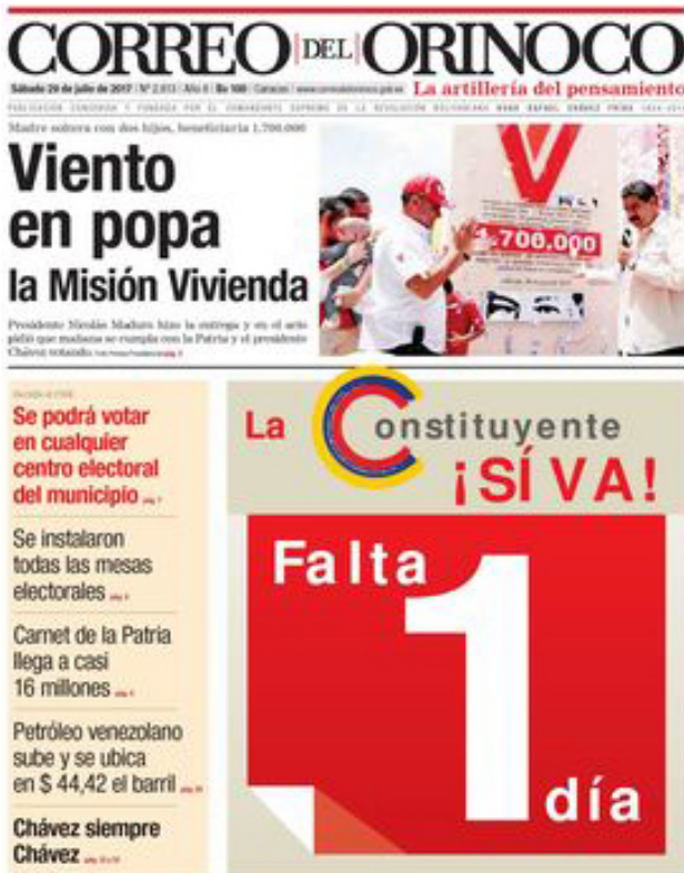
Foto 3. Portada del Correo del Orinoco del 29 de julio de 2017