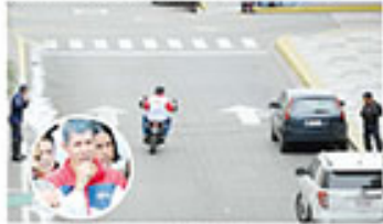
A las 12 del día la ministra autorizó el ingreso al centro

Luego de ser abuchado en dos oportunidades (en la tercera ya se había ido), el líder de Avanzada Progresista, por primera vez no se dirigió a los ciudadanos.