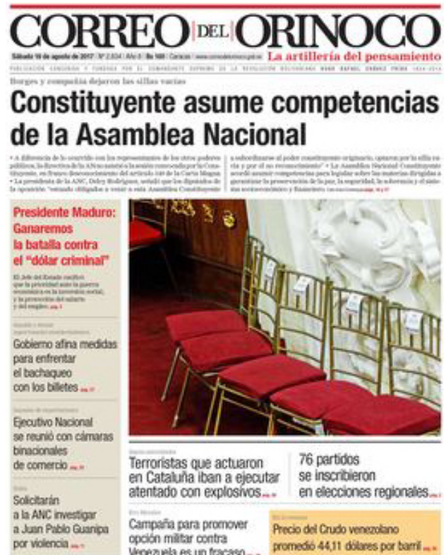
Foto 3. Portada del Correo del Orinoco del 19 de agosto de 2017