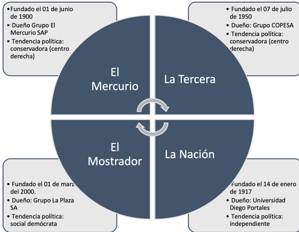
Figura 2. Periódicos incluidos en la muestra del estudio. Elaboración propia.

Los artículos incluidos en el corpus del estudio fueron obtenidos desde los motores de búsqueda de los sitios web de cada periódico, publicados entre el 01 de abril y el 31 de julio de 2020, que incluyan en cualquier apartado de la noticia los términos: 1) vuelos humanitarios o 2) repatriación de migrantes. Una de las limitaciones del estudio es que se analiza únicamente la producción noticiosa diaria publicada en el período examinado, no revisándose apartados específicos de cada periódico, como hacen algunas investigaciones sobre la prensa chi-